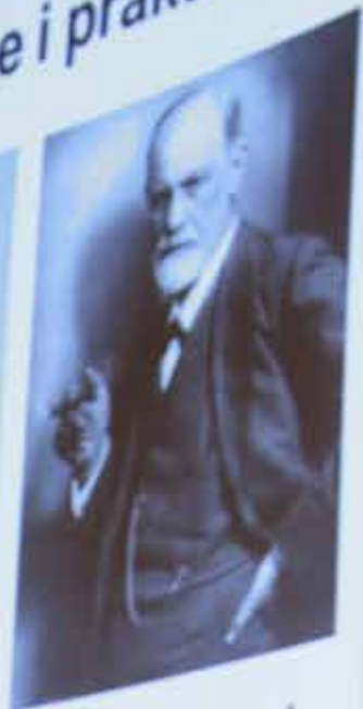
Sigismund Freud läkare i Österrike (1856-1939)