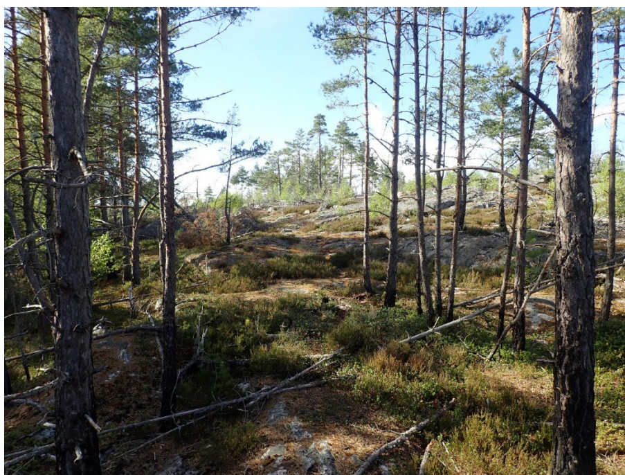
Bild 1 – Det naturvårdsbrända området i Kvädöfjärden domineras av yngre, självföryngrad tallskog på hållmarker. Inslag av äldre tallar finns här och där.