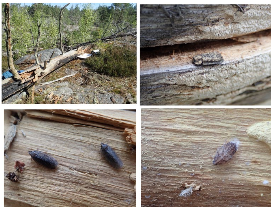
Bild 5 – Bränd tallåga med timmerticka i Kvädö med sannolika kläckhål av timmerticksnagare. Såväl timmer- som citronticka är betydligt vanligare på kolad än okolad ved. Uppe till höger skrovlig flatbagge i anslutning till timmerticka i Hästenäs. Nederst två imago av ljus vedstrit (vänster) och en larv av mörk vedstrit (höger) i samma tallåga i Hästenäs.