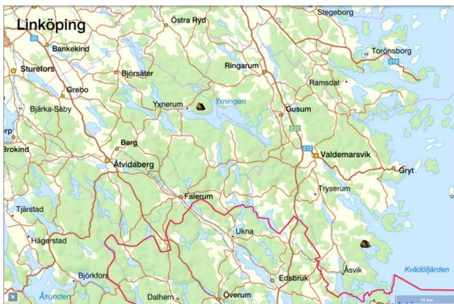
Karta 1 – De båda områdenas läge (grupper med orangea trianglar) i sydöstra Östergötlands län.