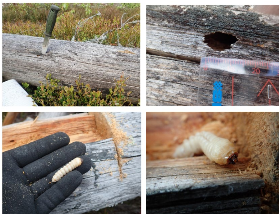
Bild 4 – Tallåga med ett enda kläckhål av raggböck, sannolikt från 2024 (de mindre kläckhålen är från praktbaggar av släktet Buprestis) samt en nästan fullvuxen larv en bit in i en annan tallåga i maj vid Hästenäs. Larven igenkänns bland annat på att huvudkapselns svartfärgade framkant har ett par breda taggar.

snabbt rötas av brunrötesvampar som klibbticka och timmerticka, samt när veden koloniserats av skogsjordmyra .