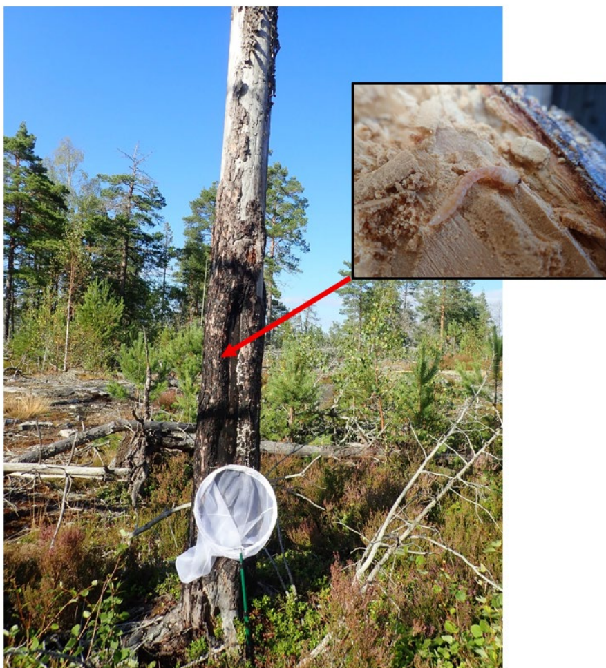
Bild 3 – Kläckhål och en nästan fullvuxen larv (20 mm) av gulfläckig praktbagge påträffades i en äldre, stående död tall i kanten av en stor stamskada riktad mot söder. Trädet har sannolikt dött långsamt efter branden. Stamskadan är troligen inte ett brandljud utan en körskada sedan senaste avverkningen skedde i området.

Fyndet gjordes i form av kläckhål och en larv som kunde identifieras utifrån Palm (1962) (Bild 3). En liknande förekomst med samma typ av kläckhål i en skadad, levande tall hittades i området, men där ingen larv kunde hittas, tillhör med stor sannolikhet samma art.