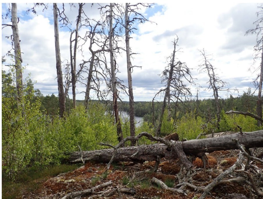
Bild 2 – Den äldre brännan i Hästenäs (naturvårdsbränd 2014) består av olikåldrig