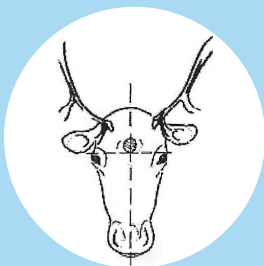
Placering av vapnet vid bedövning av renar

Vid bedövning ska vapnet placeras något ovanför en tänkt linje mellan ögonens överkant på det sätt som framgår av skissen.