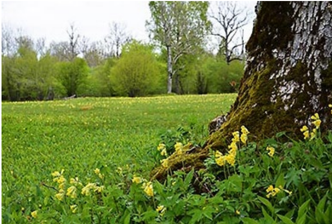
Herrfallsäng im Frühjahr Gewand.

Das Naturschutzgebiet Herrfallsäng ist ein klassischer Wuchsort mit fast 300 bekannten Gefäßpflanzarten. Für viele von ihnen ist der kalkreiche Felsboden günstig und sie sind abhängig von dem jährlich wiederkehrenden Beweiden und Mähen. Das Naturschutzgebiet dient dem Zweck, ein kalkbeeinflusstes Kulturbodengebiet mit laubbaumbewachsenen Wiesen, Weiden und hainähnlichen Laubwäldern für Forschung und Naturerlebnisse zu schützen und zu pflegen.