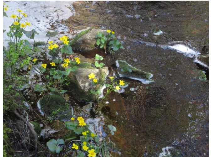
Kabellekan blommor vid Garpbäcken

I Garpbäckens naturreservat skyddas en mosaik av gamla lövträdsrika skogar för framtiden. Här lever en rad olika växter och djur som aldrig förekommer i modernt brukade skogar. Fåglar som tretåig hackspett, tjäder och tofsmes liksom mossor, lavar och svampar har sin fristad i reservatet.