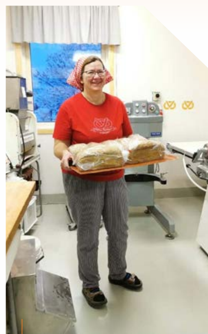
Limpor färdiga att säljas!

Localhero – ett socialt engagemang på Instagram och Facebook för att stötta lokala företag och föreningar genom att skapa en medvetenhet hos konsument av vikten att handla lokalproducerade varor och tjänster.