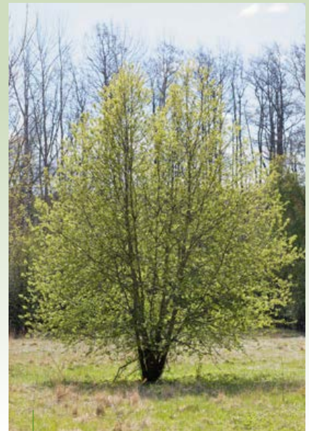
Blommande sälg på våren, den tidiga blomningen är första födan för många!

Sälg och viden är först ut att blomma på våren innan markerna grönskar och snöfläckar ännu ligger kvar. Hanbuskarna har starkt lysande gula ståndare och honbuskarna gulgröna pistiller. Sälgens protein- och energirika pollen och nektar är förrätten inför sommaren för nyväckta eller nykläckta humlor och bin. Här trivs även vanliga flugor, blomflugor, sumpflugor och hårmyggor bland blommorna tillsammans med skalbaggar. Sälgen är restaurang för massor av dagfjärilsarter som citronfjärilar, nässeljärilar och påfågelögon men även för många nattflyn. Den är helt enkelt bäst i klassen på att gynna insekterna!