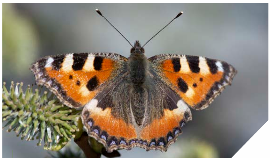
Nässelfjäril i blommande sälg