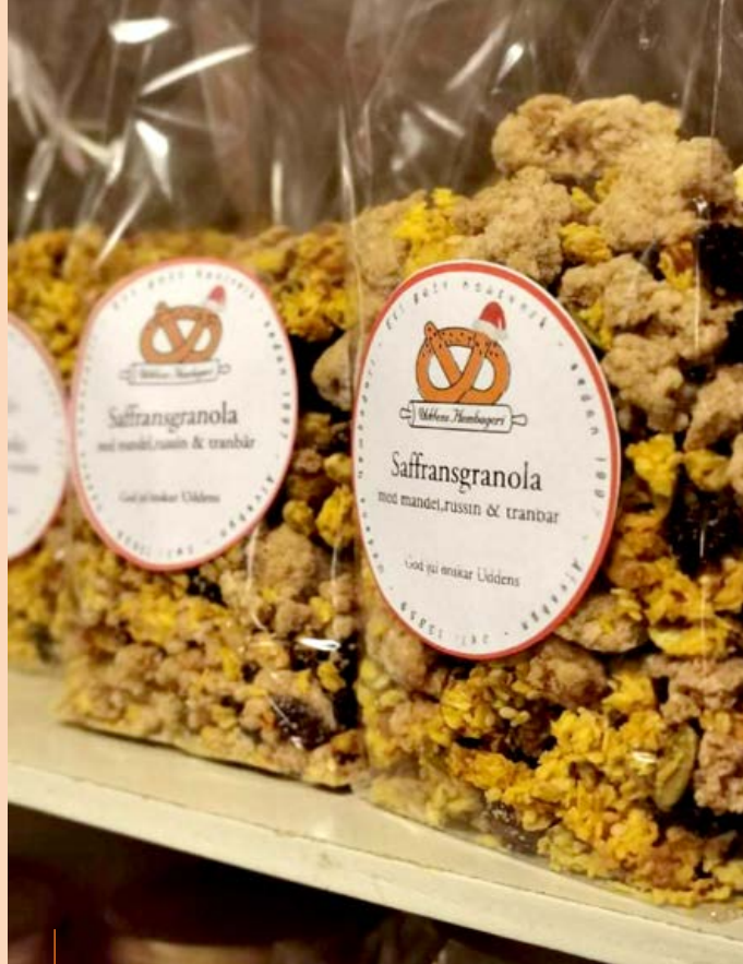
Granola – en av produkterna som skapats i bageriet.

– En råvara är en resurs, som blir en belastning om man inte tar tillvara på den hela vägen utan låter den bli spill och svinn.