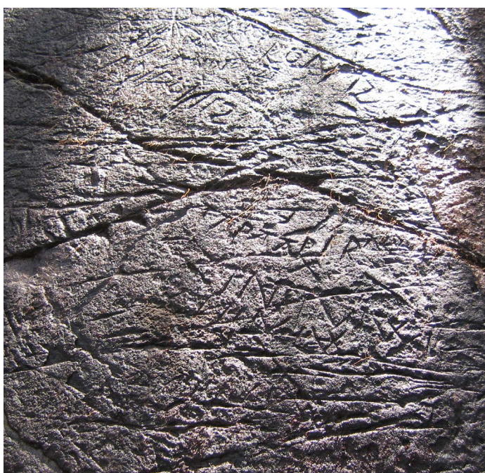
Ristningar i sten syns bäst när ljuskällan ligger horisontellt med stenen, så kallat släpljus.

I samband med skogsbruksåtgärder informerar Länsstyrelsen om den hänsyn som ska tas i enlighet med bestämmelserna i Kulturmiljölagen (1988:950).