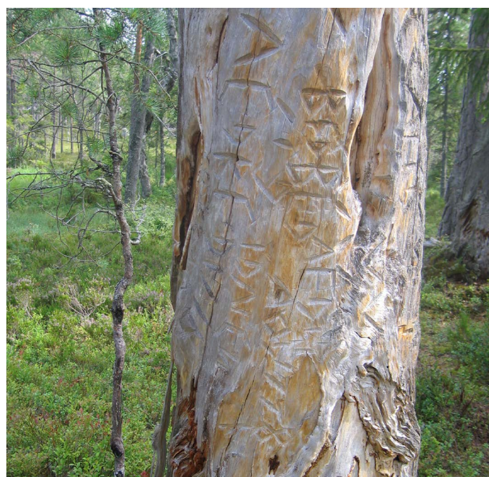
Ristningar i träd kan innehålla små meddelande som "Vi har det bra som fan".