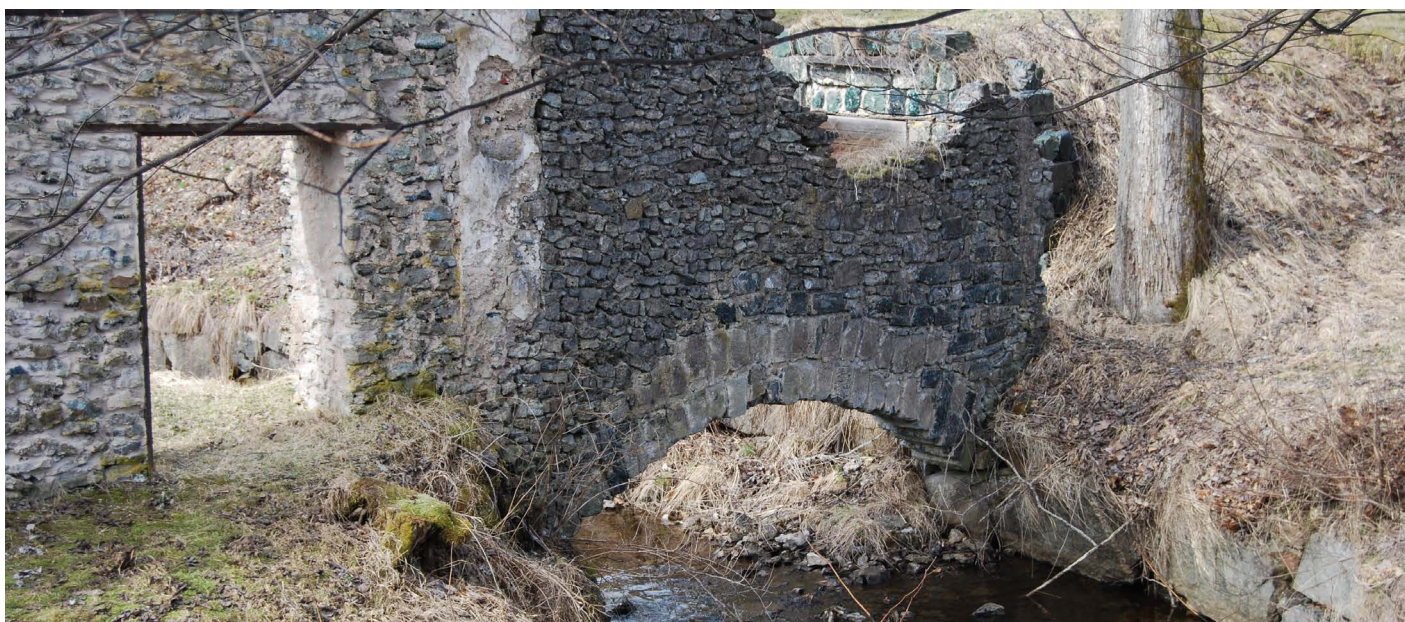
Slaggstensgrund på en hytta.

I samband med skogsbruksåtgärder informerar Länsstyrelsen om den hänsyn som ska tas i enlighet med bestämmelserna i Kulturmiljölagen (1988:950).