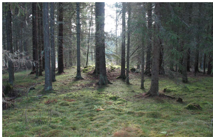
I gammal, stenröjd granskog hittar man odlingslämningar.