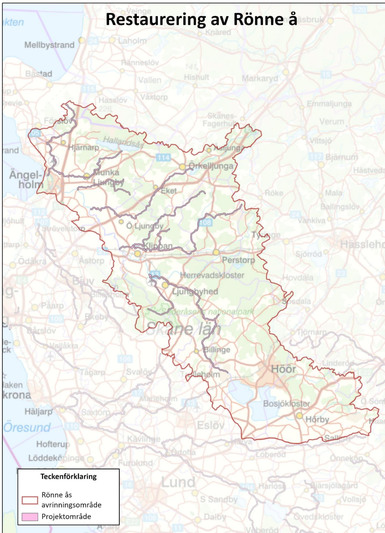
Bild: Kartan visar Rönne ås huvudavrinningsområde (röd avgränsning) samt aktuellt projektområde (rosa markering) för projektet Restaurering av Rönne å. Åtgärder planeras på olika platser inom projektområdet.