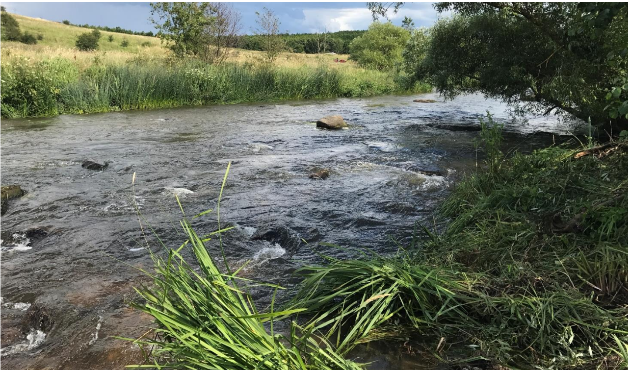
Bild: Exempel på blockrestaurerad stömsträcka vid V Sönnarslöv i Rönne ås huvudfåra. Block och sten har tagits från rensvallar längsmed strandkanten och lagts tillbaka i fåran.