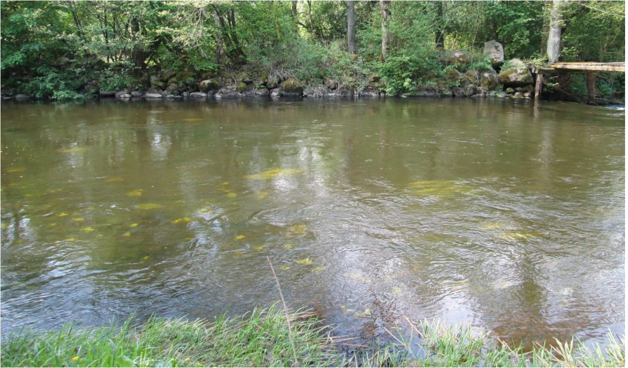
Bild: Exempel på blockrensad strömsträcka vid Järbäck i Rönne ås huvudfåra. Block och sten har tagits från fåran och lagts i rensvallar längsmed strandkanten.