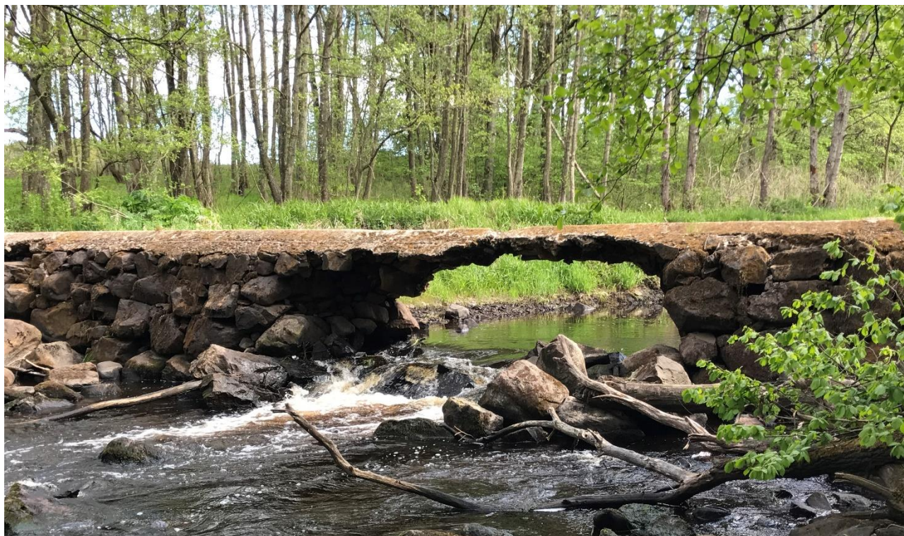
Bild: Exempel på ett partiellt vandringshinder i form av ett delvis raserat dämme i Pinnån, Rönne å, som kommer att rivas ut under projektår 1.