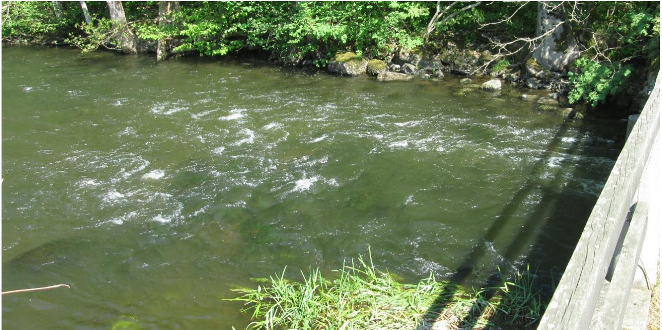
Bild: Exempel på en strömvattensträcka i övre delarna av Rönne å där sten och block dragits in till kanten och det finns behov av biotopvård. Inom några år kommer bland annat lax och havsöring kunna passera förbi Klippan och nå samtliga sträckor i ån.

Rönne å | Ängelholms, Åstorps, Klippans, Eslövs och Höörs kommun | HARO 96