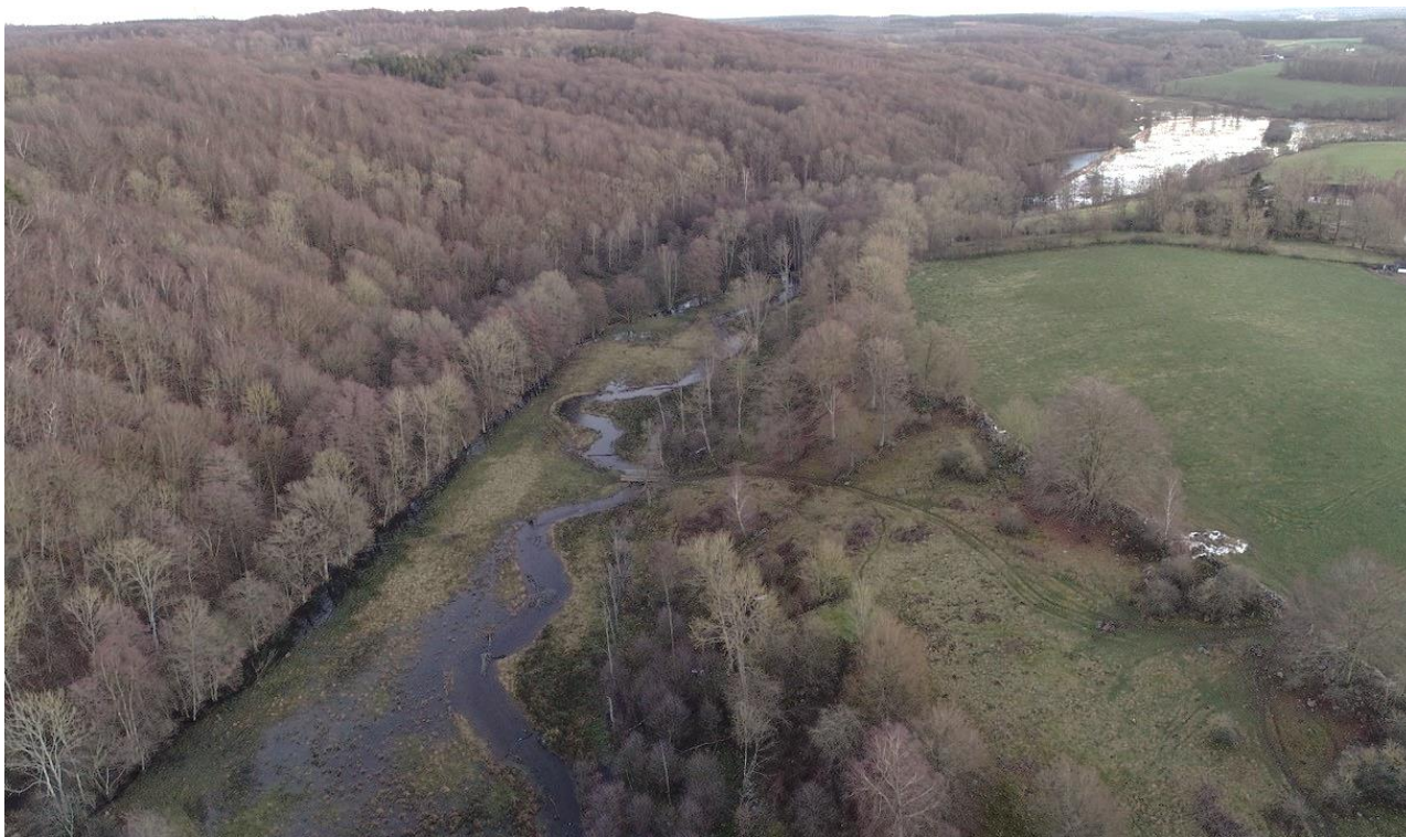
Bild: Exempel på återmeandrad sträcka vid Bauseröd i Hallabäcken, Vege å. En meandrande fåra har återställts och det tidigare rätade diket (längsmed trädriddån till väster) har lagts igen.