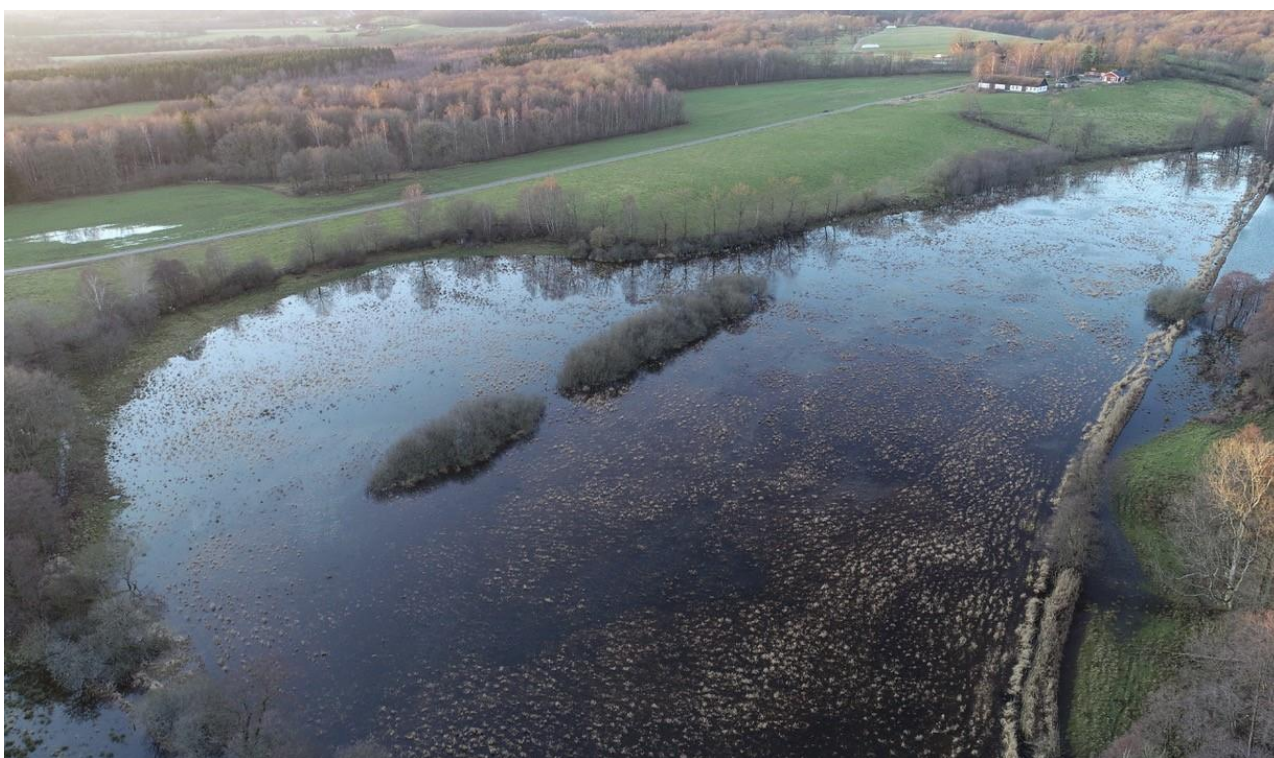
Bild: Exempel på återställt svämplan vid Bauseröd i Hallabäcken, Vege å. En meandrande fåra har återställts och det tidigare rätad diket (till höger) har lagts igen.