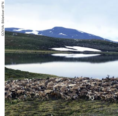
Bohccot Oarje stuorrváris

DAVVISÁMEGIELLA sarva ráantjoe aaltoe, giehke miesie