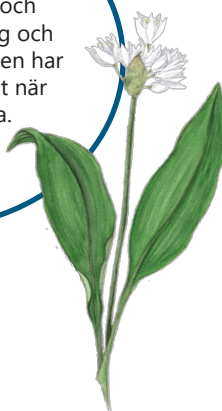
Illustration: Katarina Månsson

Ramslök växer i stora bestånd på den kalk- och mullrika jorden i lövskog och lundar under maj-juni. Den har en stark lökdoft, särskilt när bladen börjat vissna.