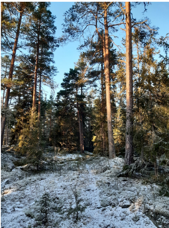
Fig. 2. Äldre, talldominerad skog på Bobergets krön.

På de magra markerna i högre lägen, d.v.s. större delen av området, är tall dominerande i det högsta trädskiktet, med lägre skikt av framför allt gran i olika åldrar (se Fig. 2). En hel del äldre, grov björk och asp förekommer också. På berghällar är trädskiktet glest, och de äldre barrträden är tydligt senvuxna. Markvegetationen består främst av blåbär, lingon, vanliga skogsmossor samt olika bägar- och renlavar. Bland lite mer krävande arter som trivs i den ostörda barrskogen kan nämnas tofsmes, svartmes, talltita, tjäder och motaggsvamp (se Tabell 1).