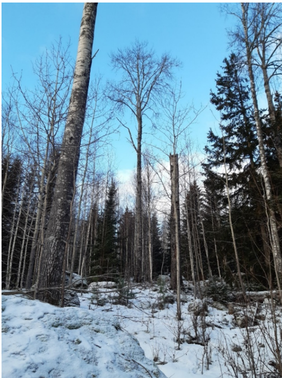
Fig. 3. Hygge med kvarlämnade gamla aspar.

I hela området finns gott om gamla, grovbarkiga tallar och granar med knotiga grenar. Gamla och grova träd är viktiga som växtplatser för många ovanliga kryptogamer, och i reservatsområdet har t.ex. garnlav hittats på gamla tallar. Grova träd – gärna asp – nyttjas också som boplatser av hålhäckande fåglar som skogsduva Columba oenas , spillkråka och gröngöling Picus viridis , alla påträffade i området. De gamla aspar som lämnats kvar på det lilla hygget i sydöstra delen av reservatet är värdefulla då de, förutom som häckplatser för fåglar, kan tjäna som växtplatser för flera ljusälskande arter av bland annat lavar som trivs på just asp (se Fig. 3).