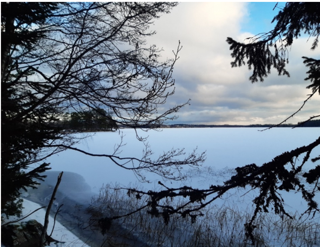
Fig. 4. Utsikt över Hörendesjön österut vintertid.

Reservatet är avsides beläget och inte helt lättillgängligt, och är troligen sällan besökt förutom av boende i trakten. Det nås enklast via en traktorväg som går söderut från vägen mot Kråkebo by (se karta, bilaga 2.1), samt båtledes över Hörendesjön. Det är önskvärt att fler människor hittar hit, då det är en utmärkt plats för rekreation och naturupplevelser. På många platser har man en vacker utsikt över sjön (se Fig. 4), och trots att det finns gårdar och åkermarker i närheten är vildmarkskänslan i området påtaglig.