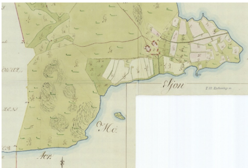
Fig. 1. Utsnitt ur storskifteskartan (1807). Boberget syns nere till vänster, som molnliknande formationer. Kråkebo by med åker- och ängsmarker uppe till höger.

Nästa karta är storskifteskartan över "Kråkbo ägor" från 1807 (se Fig. 1). Vid skiftet har skogsmarken på Boberget fördelats på lotter till de olika hemmanen i Kråkebo by, så berget hade ett visst ekonomiskt värde som utmark. Det ser ut som att markanvändningen då knappast hade förändrats sedan geometriska kartans tid. Lagaskifteskartan från 1840 säger också i stort sett detsamma som storskifteskartan.