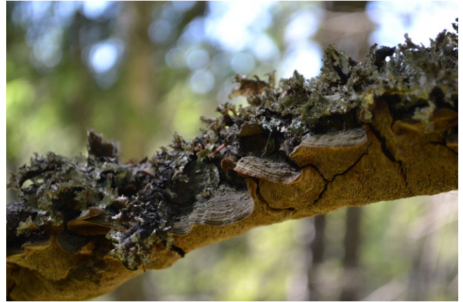
Grangren med granticka ovan.

Naturreseptat Borgaberget består av en varierad gammelskog. Här möter du karga tallskogar, frodiga barrblandskogar och fuktiga lövsumpskogar. Uppe på själva Borgaberget ligger en gammal fornborg. Notera att inga vägar leder fram till reservatet, men både den omväxlande naturen och fornborgen är mödan värd för den som letar sig hit.