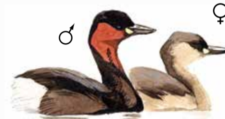
Smådopping Tachybaptus ruficollis Little grebe Zwergtaucher