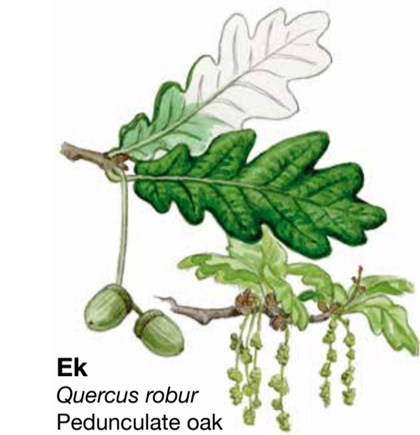
Ek Quercus robur Pedunculate oak Stieleiche