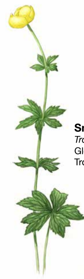
Smörbollar Trollius europaeus Globe flower Trollblume