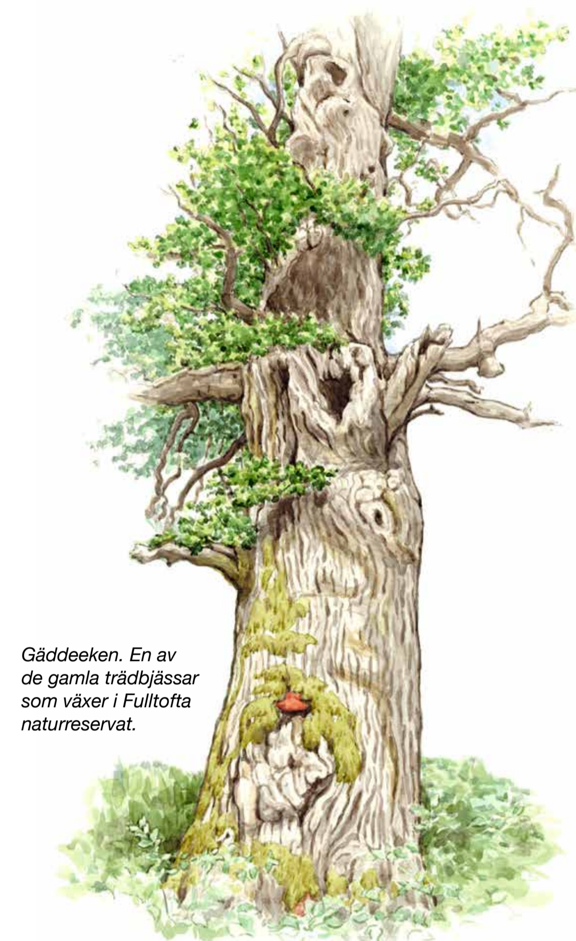
Gäddeeken. En av de gamla trädbjässar som växer i Fulltofta naturreservat.