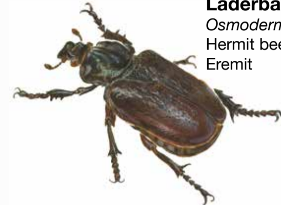
Läderbagge Osmoderma eremita Hermit beetle Eremit