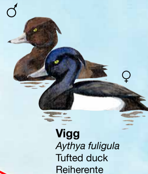
Vigg Aythya fuligula Tufted duck Reiherente

I naturreservaten Fulltofta och Fulltofta-Häggenäs finns mycket att upptäcka. Det gamla kulturlandskapet är rikt på fornlämningar. Här finns också en av Skånes äldsta ekar, lummig ädellövskog, blomsterrika hagar och ett rikt fågelliv.