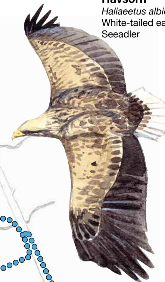
Havsörn Haliaeetus albicilla White-tailed eagle Seeadler