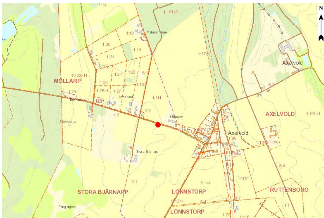
Detalj-karta, röd prick anger naturminnets läge. Skala ca 1:10 000.