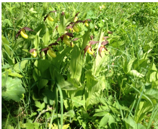
Guckusko, smörbollor; Latorpsängarna.