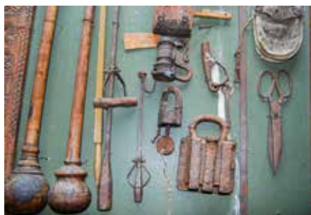
Föremål i Vingåkers hembygdsmuseum, Vita museet.