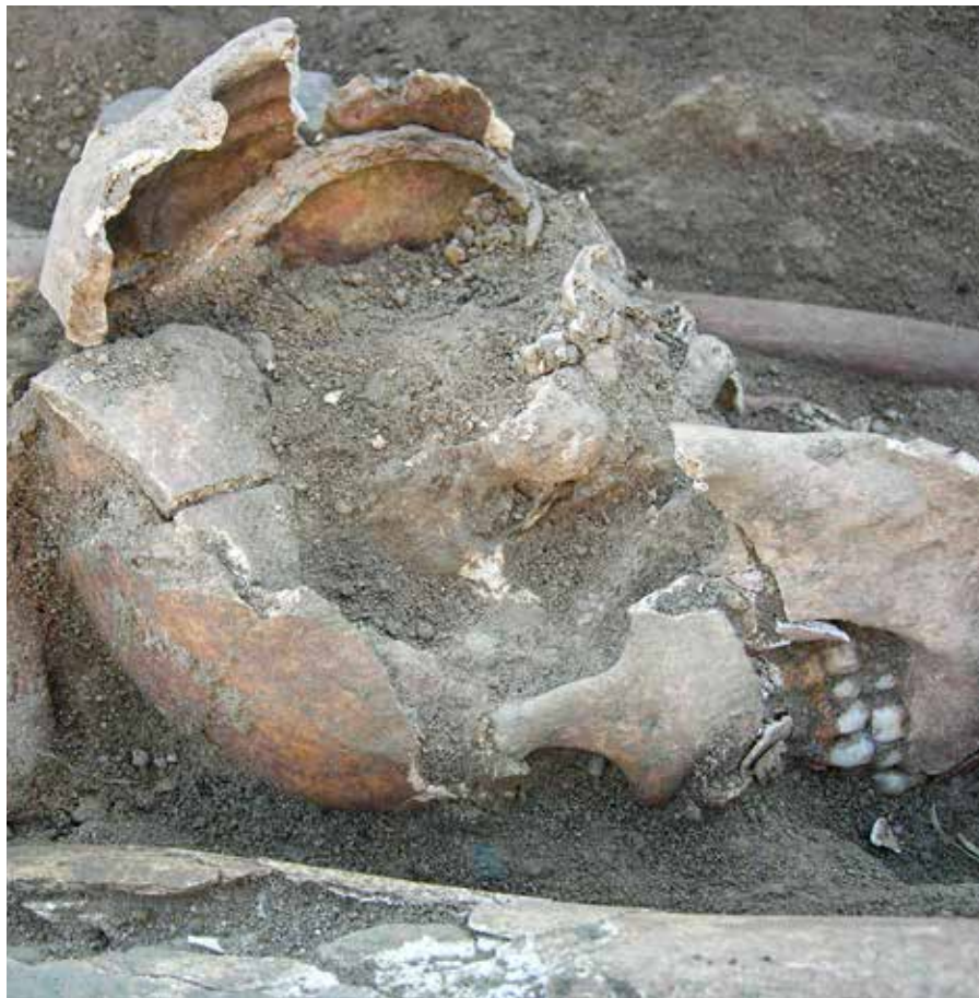
Människoskalle från arkeologisk undersökning av avrättningsplats utanför Vadstena.