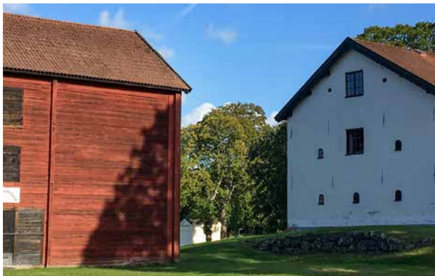
Vingåkers hembygdsmuseum, Vita och Röda museet.

Västra Vingåkers hembygdsförening bildades år 1935. Förutom museet har hembygdsföreningen ett arkiv där de förvarar gamla fotografier, protokoll och tidningsurklipp, register över gårdar och torp i Västra Vingåkers socken och många andra dokument.