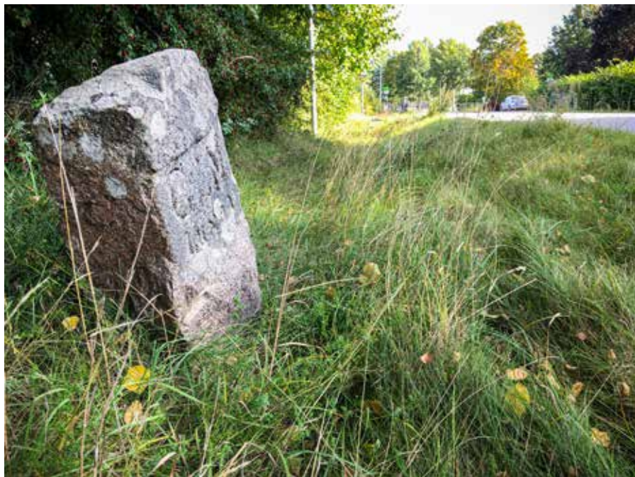
Vaghållningsstenen i diket.