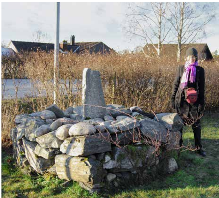
Milstolpen inne i en trädgård vid vägen.

Bönderna hade också skyldighet att skjutsa kungen, hovet och statsanställda till olika platser. Under 1600-talet infördes skjutspengar till bönderna. Ersättningen grundade sig på hur lång resan var och därför behövdes ett enhetligt måttsystem. Milstolpar placerades ut på väl innmätta platser utmed de allmänna vägarna och markerade en fjärdedels, en halv eller en hel mil. År 1836 gjordes en kontroll av milstolpar i Oppunda härad, dit Västra Vingåkers socken hör. Sannolikt har den här milstolpen rests i samband med detta, men texten på milstolpen är så nött att den inte går att läsa.