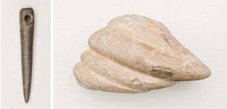
Hängsmycke av skiffer och marleka.