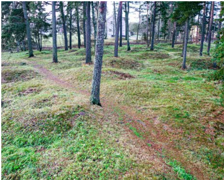
Del av gravfältet.

I Vingåkers kommun finns det elva gravfält och därtill ett sextiotal ensamliggande gravar bevarade från bronsåldern och järnåldern. I en fin naturpark nära Sävstaholm ligger det största järnåldersgravfältet där det finns 105 synliga högar och stensättningar. Människor har begravt sina döda på gravfältet under vendeltid och vikingatid.