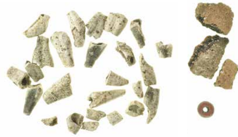
Gravfynd från Vingåker. Krukskärvor, röd glaspärla och tänder från människa.