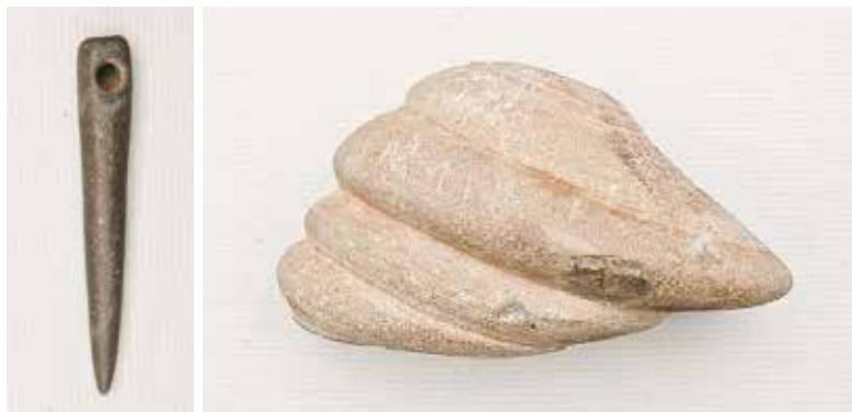
Hängsmycke av skiffer och marleka.