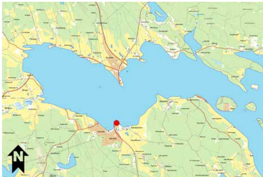
Vattennivån i Vingåker för 6 500 år sedan. Vattnet stod då ungefär 40 meter högre än idag.

Innan gravfältet byggdes fanns det en boplats här. Det var på stenåldern för 6 500 år sedan. Vattnet var då 40 meter högre än idag. Människorna på stenåldern var jägare och samlare. De hade redskap av sten.