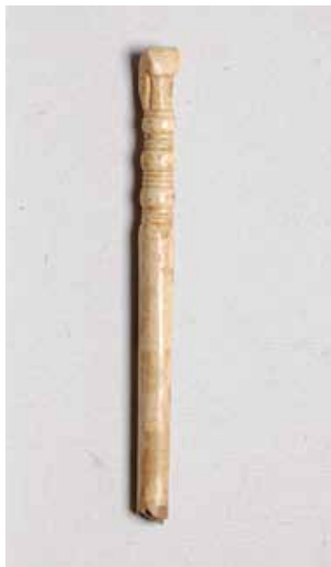
En stylus av ben från Vreta klosterkyrka i Östergötland.

Vid utgrävningar på 1970-talet hittade man bland annat murar från dominikanernas kyrka, en tegelsten med runor och en stylus. Runorna har tolkats som den magiska formeln ” abrakadabra ” som är känd sedan 200-talet.