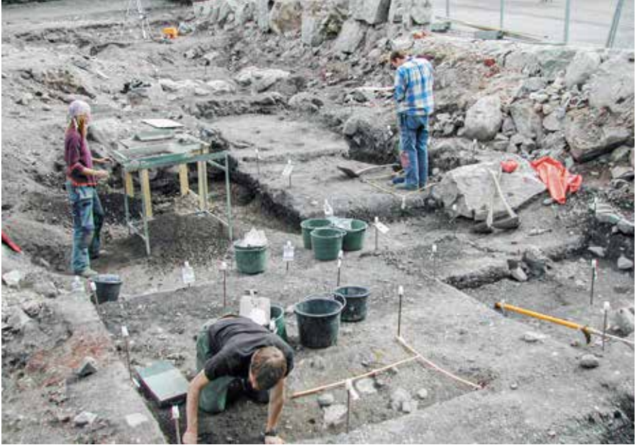
Arkeologisk undersökning i kvarteret Bodarne år 2004.