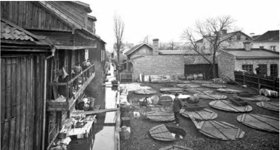
En garvaregård i Jönköping för ungefär 100 år sedan.