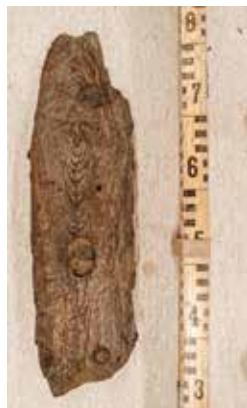
Del av en av båtarna i Västerviken.

De båda båtarna ligger mellan två och tre meter under vattenytan. Den ena är ungefär sex meter lång och har klinkbyggda sidor och en flat, kravellbyggd botten. Trä från båten har daterats med 14 C-metoden. Kanske har det varit en mindre segelbåt? Av den andra båten har bara två träbitar hittats. Träet kunde dateras dendrokronologiskt till år 1819.