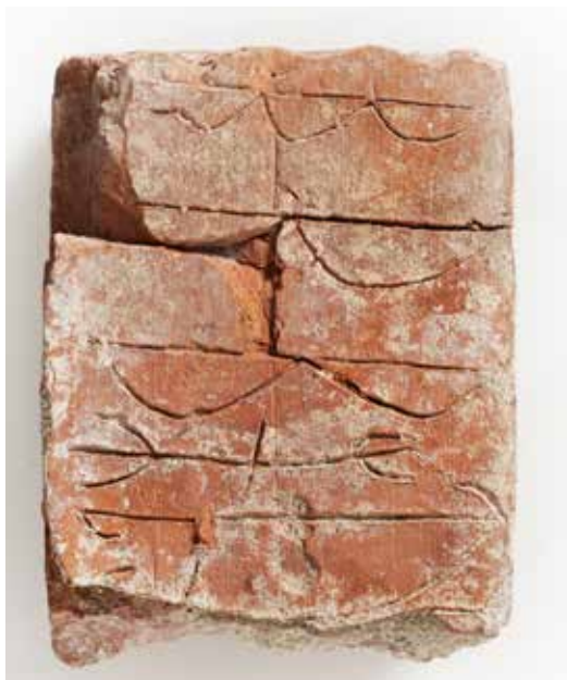
Del av en medeltida tegelsten från kvarteret Klostret.