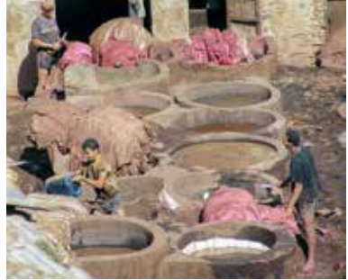
Traditionell skinngarvning i Marocko.

Garvare är ett gammalt yrke. Ända sedan stenåldern har man behövt skinn till kläder och annat. Genom att garva skinn och hudar hindrade man dem från att ruttna. Svearna var berömda för sina fina, välgarvade skinn som de sålde till romarriket.