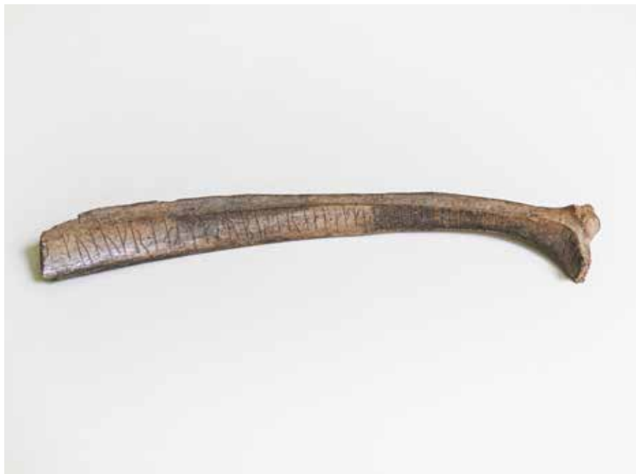
Kungabenet från Sigtuna.