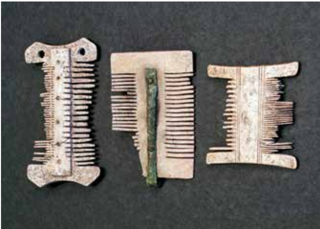
Kammar av ben och horn från Bodarne.