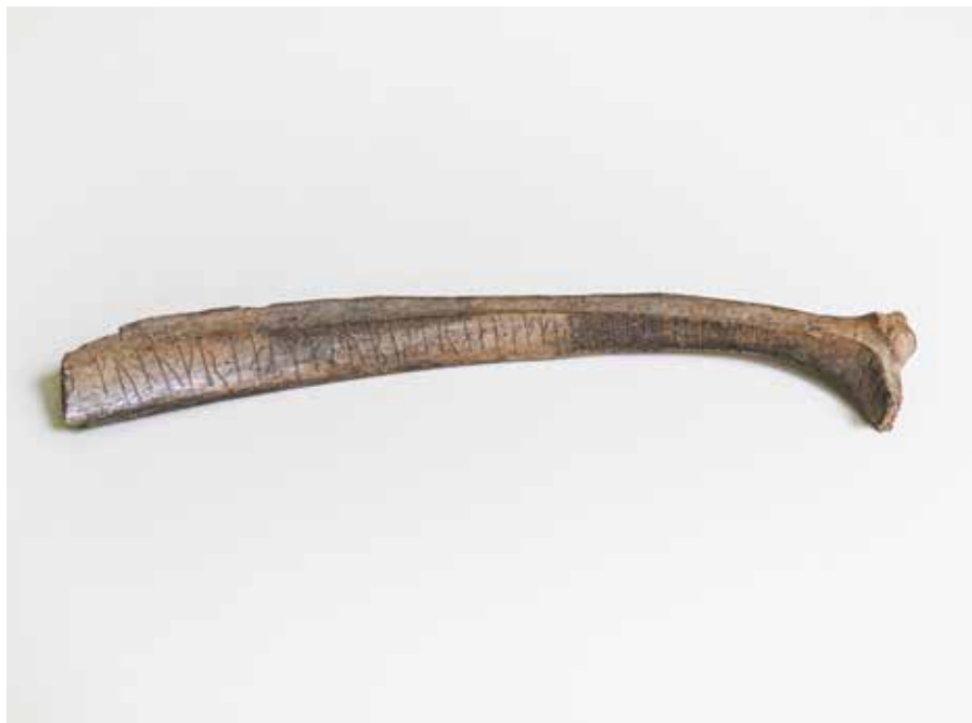
Kungabenet från Sigtuna.

På den andra runstenen i gräset står det ”... han var den gästfriaste av alla män i världen ... ”. I Sigtuna har man hittat en benbit med runor. Någon har ristat: ” Marre skänkte revbenen. Han äger mest egendom ”. På andra sidan står det ” Kungen är den bästa mannen. Han äger mest egendom. Han är givmild ”. Benet kommer kanske från en stor middag.