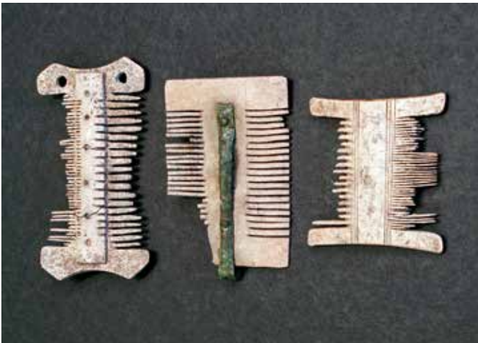
Kammar av ben och horn från Bodarne.