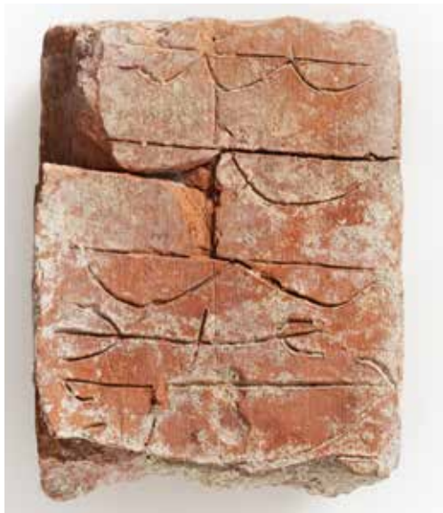
Del av en medeltida tegelsten från kvarteret Klostret.