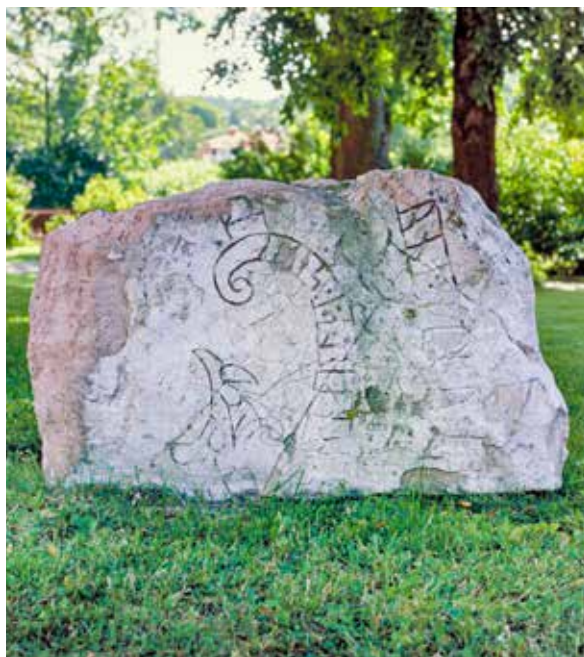
På stenen (plats 5) står det "E... hugga stenen ... Emunds söner ... söderut i Särkland" .

Flera runstenar i området berättar om Ingvar och hans släkt. Emund och Ingvar var kanske stormän och bodde kanske nära Strängnäs.