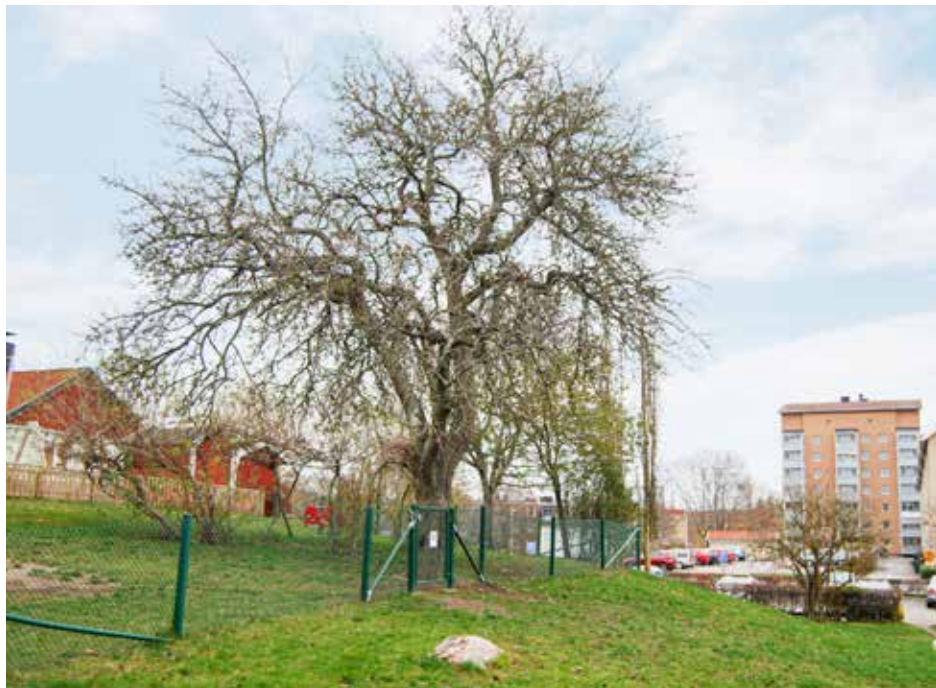
Päronträdet där Oxelö gård har legat.