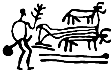
Hällristning med bonde från bronsåldern, omkring 3 500 år före nutid.