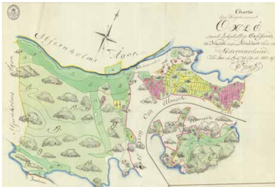
Oxelö by med omgivande åkermark år 1821.

I samband med att Oxelösund växte på 1950-talet började åkermarken runt Oxelö bebyggas med flerfamiljshus. År 1961 revs gården för att ge plats åt dagens Oxelö förskola. Som ett minne av gården finns ännu ett stort päronträd kvar framför förskolan och på bergknallen i norr finns rester av en jordkällare.