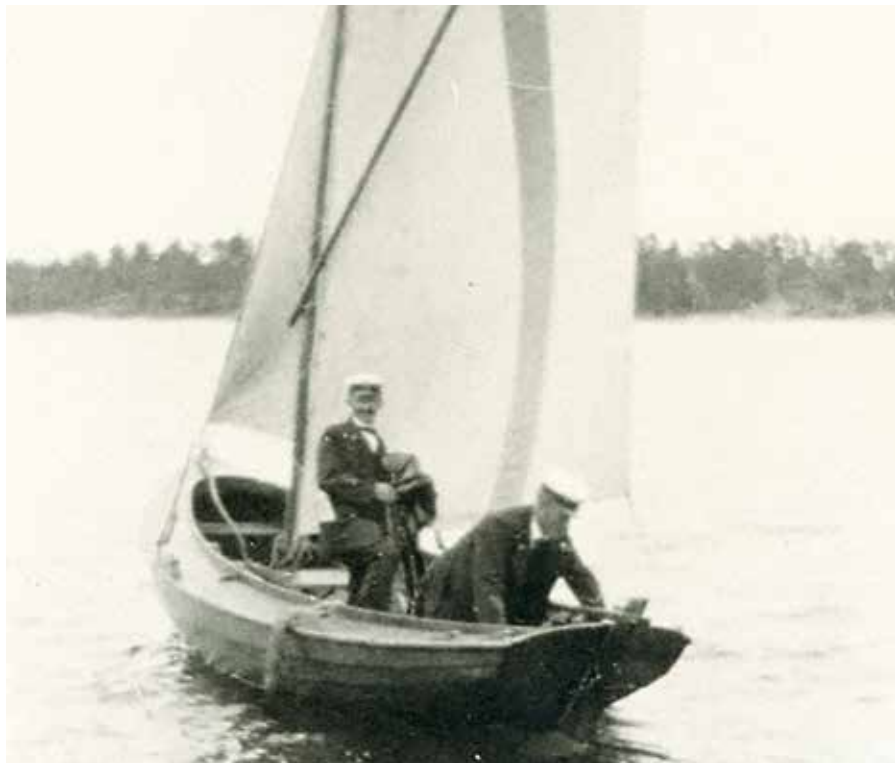
Lotsbåt utanför Oxelösund omkring år 1915.