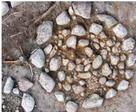
En järnåldersgrav som den ofta ser ut när jorden och gräset är borta.