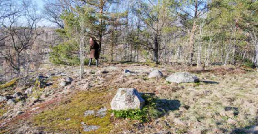
Den forntida graven vid Frösäng.