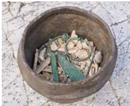
En gravurna från bronsåldern med brända ben och gravgåvor av brons.