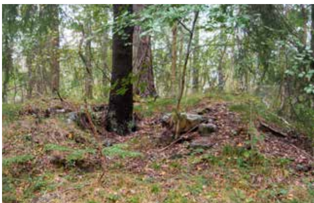
Jordkällaren vid torpet Aspastugan.