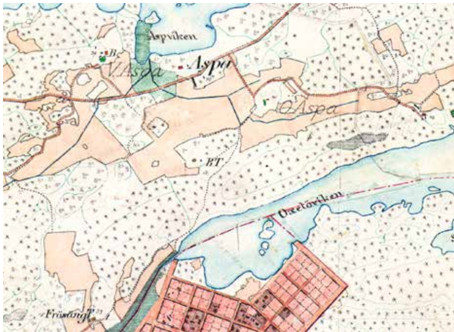
Övergivna Öster Aspa, Väster Aspa och båtsmanstorpet Aspastugan (BT) samt 1900-talets Aspa gård.

En bondgård var självförsörjande. I arbetet ingick att man skulle så, skörda, tröska, slakta, plocka bär, odla grönsaker och frukter, fiska och jaga, fälla skog, hugga ved, mjölka och ysta, sköta gårdens kor, hästar, får och grisar, slå hö, hämta vatten, tillverka redskap, underhålla gårdens byggnader och föremål, klippa ull, spinna, odla och bereda lin, väva och sy m.m.