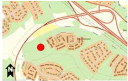
Röset vid Peterslund och dess plats på kartan.

På udden av det som var en liten ö för ungefär 2 500 år sedan, anlade några järnåldersmänniskor en grav efter en släkting eller vän som dött. Idag ligger den på krönet av en bergknalle nära Frösängs kyrkogård. Av graven finns bara enstaka stenar kvar. Den har varit större, men enligt uppgift har man tagit stenar från graven, när man byggde en ladugård vid torpet Frösäng.