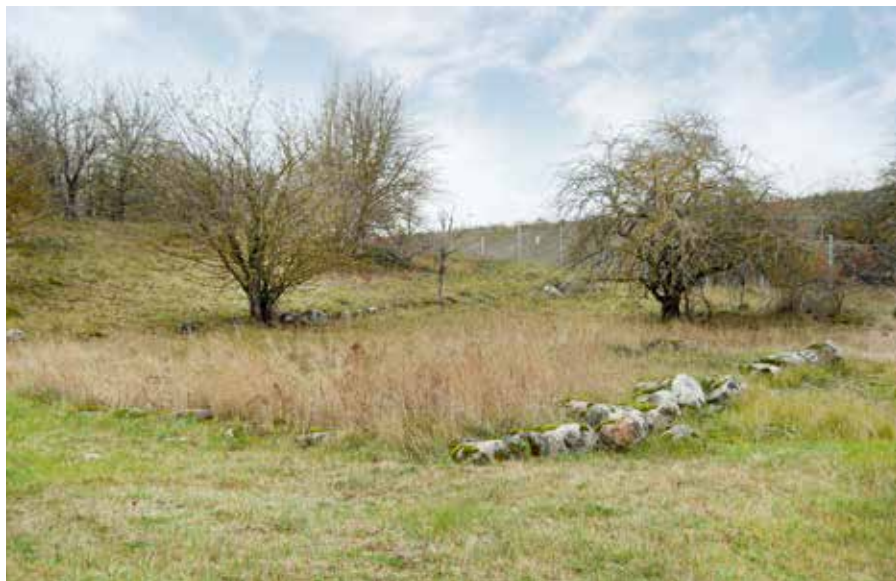
Öster Aspa bytomt.