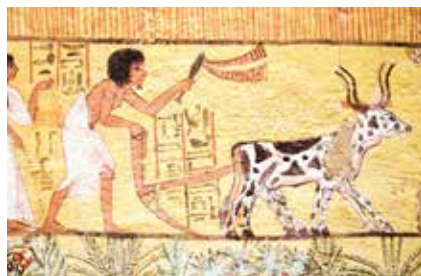
Bonde från Egypten, omkring 3 200 år före nutid.