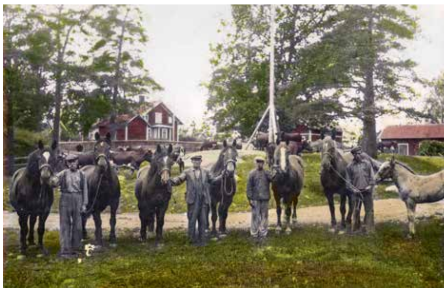
Aspa gård och dess hästar omkring år 1930.