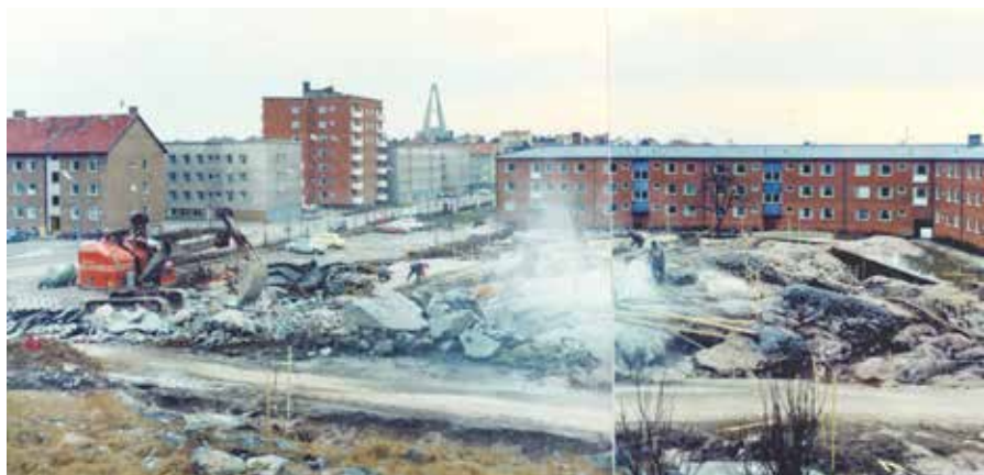
Platsen för Oxelö gård inför byggnationen av Oxelö förskola.