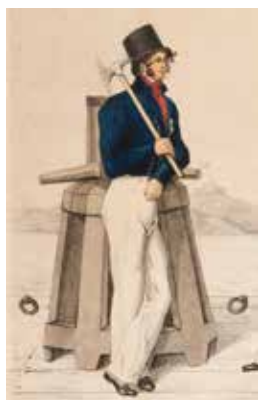
En båtsman år 1824.

På platsen växer både snöbärsbuskar och syrener. Eftersom platsen för torpet är övergiven och fanns före år 1850, är Aspastugan en lagskyddad fornlämning.