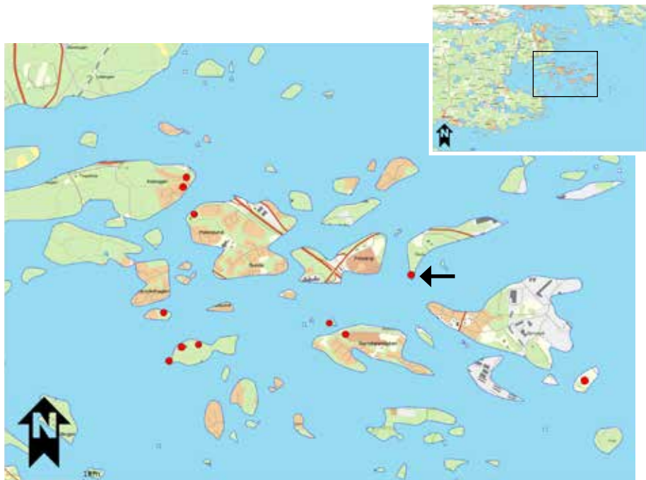
Oxelösund för cirka 2 500 år sedan. Röda prickar markerar gravar. Pilen visar gravan vid Frösäng.

De äldsta spåren efter människor i Oxelösund är ett tiotal rösen och stensättningar från bronsåldern och den äldsta järnåldern, tiden för cirka 3 500 till 2 000 år sedan. Tidigare låg hela området under vatten. Det beror på att hela Sverige för 15 000 år sedan var täckt av ett kilometertjockt istäcke, inlandsisen. När isen smälte, släppte trycket på jorden och markytan steg långsamt upp ur vattenmassorna. Allt sedan dess har landet fortsatt att höja sig. I början gick det snabbt. Idag går det långsammare, cirka fyra meter på tusen år i Sörmland.