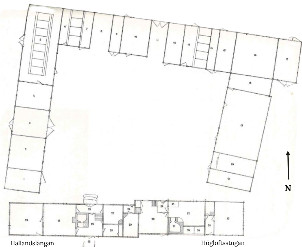
8. Larsagårdens planlösning uppmätt av Albert Sandklef före flytten från Lustorp. På sin nya plats på Katrinebergs Folkhögskola placerades byggnaderna på samma sätt i förhållande till väderstrecken. Bild hämtad från Hallandsgårdar av A. Sandklef.

Det förekommer olika uppgifter om vilka fasadmaterial som användes när Larsagårdens långloftsstuga uppfördes men det ursprungliga takmaterialet kan ha varit halm, vilket senare ersatts med spåntäckning men det finns också uppgifter om att det nya bostadshuset ska ha fått tegeltak. I det nya huset installerades även kakelugnar, i storstugan innebar det att den öppna spisen ersattes. I samband med nybyggnationen av den västra bostadshuset genomgick även den östra gårdens högloftsstuga en modernisering men inte alls lika omfattande. Här nöjde sig ägarna med att brädfodra fasaderna och måla dem med rödfärg.