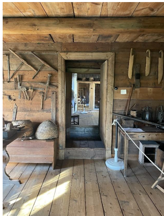
12. Interiör högloftsstugan 2025. Byggnaden fungerar idag som hembygdsmuseum. Till vänster spiskomplex med uppsvängd kåpa, liknande Mejboms teckning 1884, se bild 7. Till höger vy från östra häbbret mot ryggåsstugan.