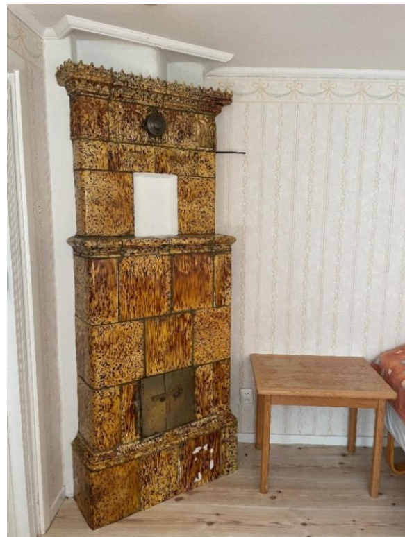
17. I Hallandslängan finns två kakelugnar av hantverkstyp.