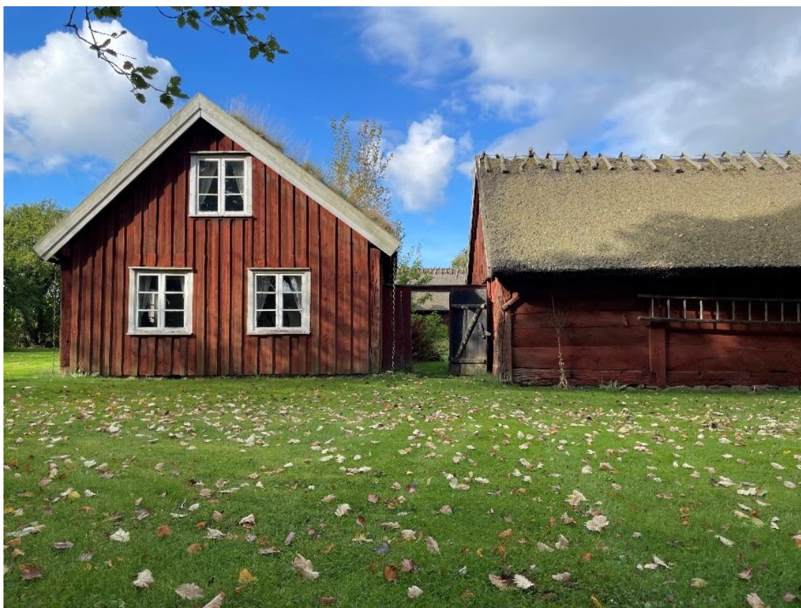
22. Vy från öst. Häbbre och uthus sammankopplas av ett rött plank med svart port.