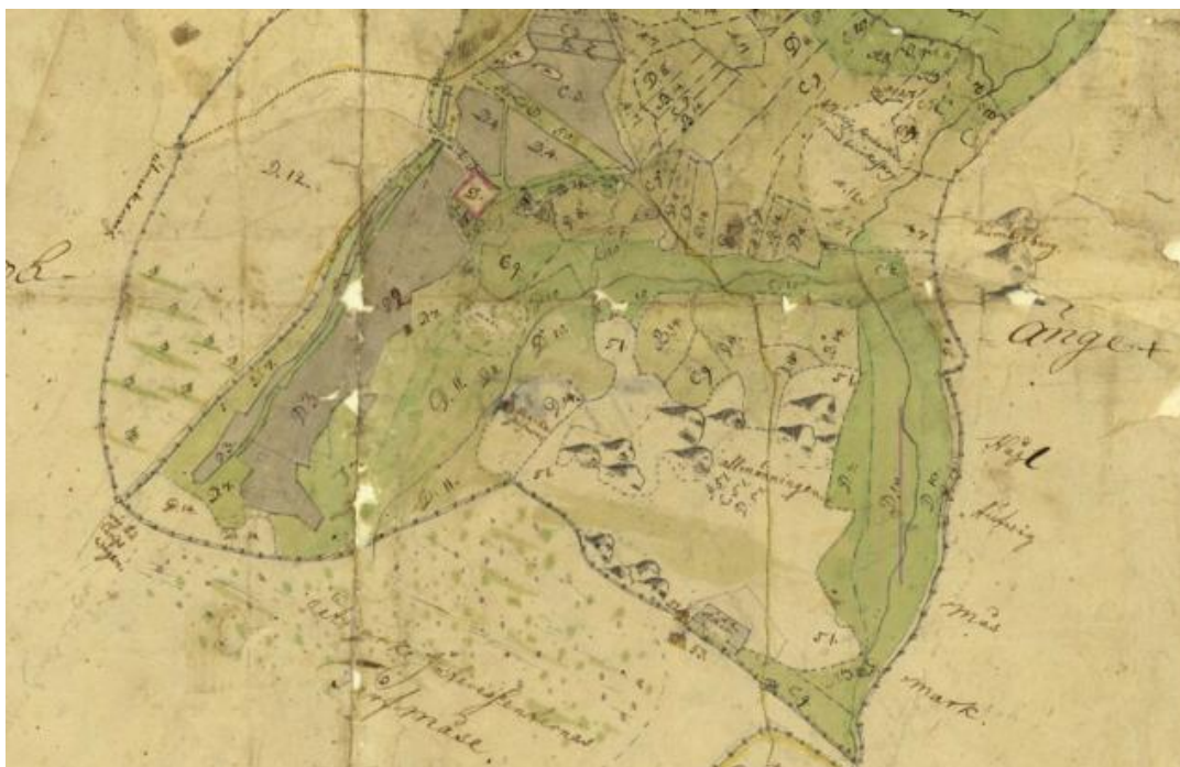
5. Karta från 1751 som visar Larsagården på sin ursprungliga plats i Lustorp. Byggnaderna är markerade med rött.

Under det tidiga 1700-talet präglades den halländska jordbruket starkt av de många stridigheter som tidigare drabbat området i dess roll som gränsbygd. När krig orsakat att hus och åkrar brändes fanns inte mycket möjlighet till utveckling av jordbruket. Men vid mitten av 1700-talet och fram till slutet av 1800-talet förändrades förutsättningarna och därmed också jordbruket. Nya redskap och tekniker gjorde det möjligt med nyodling vilket innebar större avkastning för bönderna. De var inte bara längre självförsörjande utan kunde nu också sälja det som blev över och fick därmed en starkare ekonomi. Gårdarna växte och så även befolkningen.