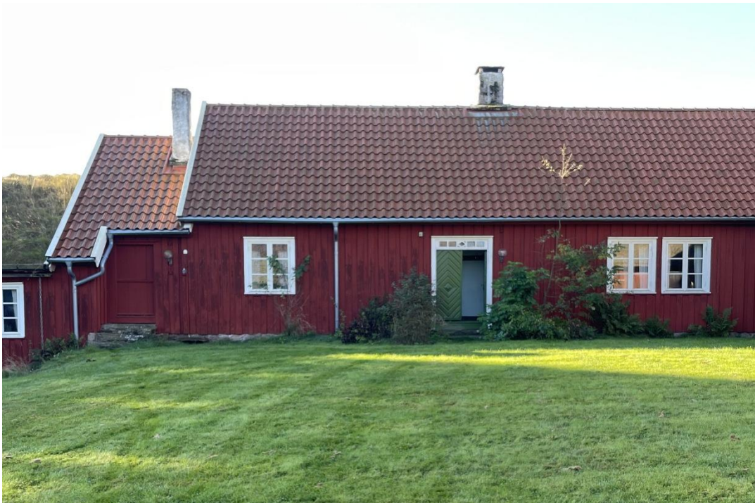
16. Hallandslängans norra fasad med karaktäristiskt dubbla fönster i stugan till höger. Längst till vänster den lite lägre tillbyggnaden som innehållit separat förstuga och kammare. Idag ingår utrymmet i övernattningslägenheten och nås enbart från insidan. Takavvattningen har modern karaktär.

På hallandslängans södra fasad leder en vitmålad dörr till en övernattningsbostad för skolans personal. Lägenheten omfattar Hallandslängans östra del samt den lägre förstugan/kammaren och innehåller 2 rum och kök samt toalett och duschrum. I köket finns ett äldre vitmålat brädtak och ljusgrön köksinredning, troligen från tiden då Larsagården flyttades till Katrineberg. Här finns också ett murat spiskomplex med bakugnslucka i järn. Övriga rum har spänntak och väggar klädda med ljus papperstapet. Hela bostaden har golv belagda med en ljus träimiterande plastmatta. I rummet längst åt öst finns en hantverkskakelugn med släta kakelblad, stänkglasyr i bruna toner, profilerad fotsims och mittsims samt avslutande fris och krona utsmyckad med stiliserad dekor. Kakelugnen har en grund nisch i övre partiet, vilken är vitmålad.