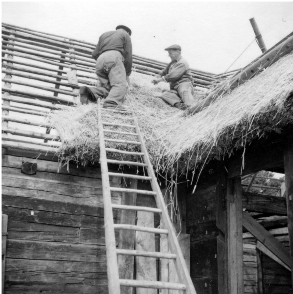
10. Halmtäckning av ett av uthustaken i samband med flytten av Larsagården 1958.

tillägg i samband med flytten. På invigningen lyste gårdens fasader av rödfärg och samtida tidningsartiklar beskriver hur den gamla gården återuppstått och fått ett nytt liv. På den nya platsen genomgick Larsagården också ytterligare moderniseringar; elektricitet, centralvärme och vatten installerades. I Långloftsstugans östra del inreddes en lägenhet som vaktmästarbostad och de västra rummen gjordes om till samlingslokaler. 1972 gjordes dessa rum om ytterligare en gång för att bättre passa verksamheten.