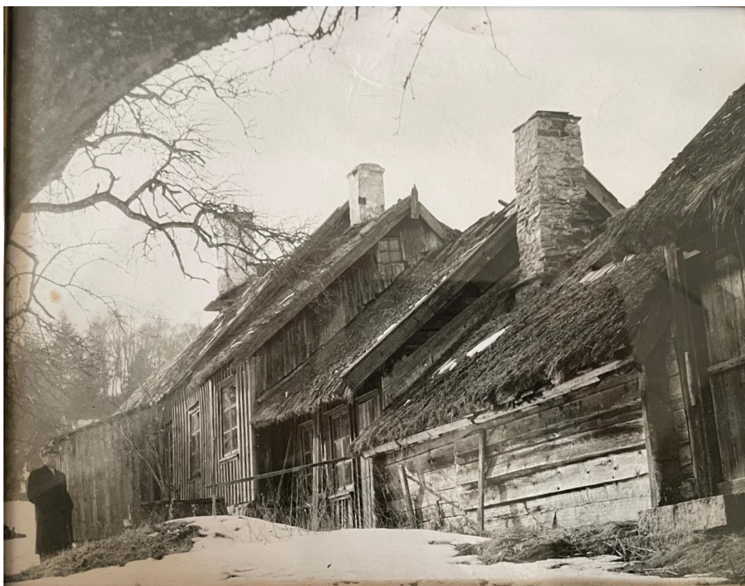
14. Nästan samma vy 2025 och 1958. Nedre bilden ett fotografi som enligt text på baksidan är taget 1958 dagen innan Larsagården togs ner och flytten påbörjades till Katrineberg. Fotot hänger idag på väggen i Larsagårdens samlingssal. Larsagårdens byggnader hade innan flytten stråtak och fasaderna grånade.