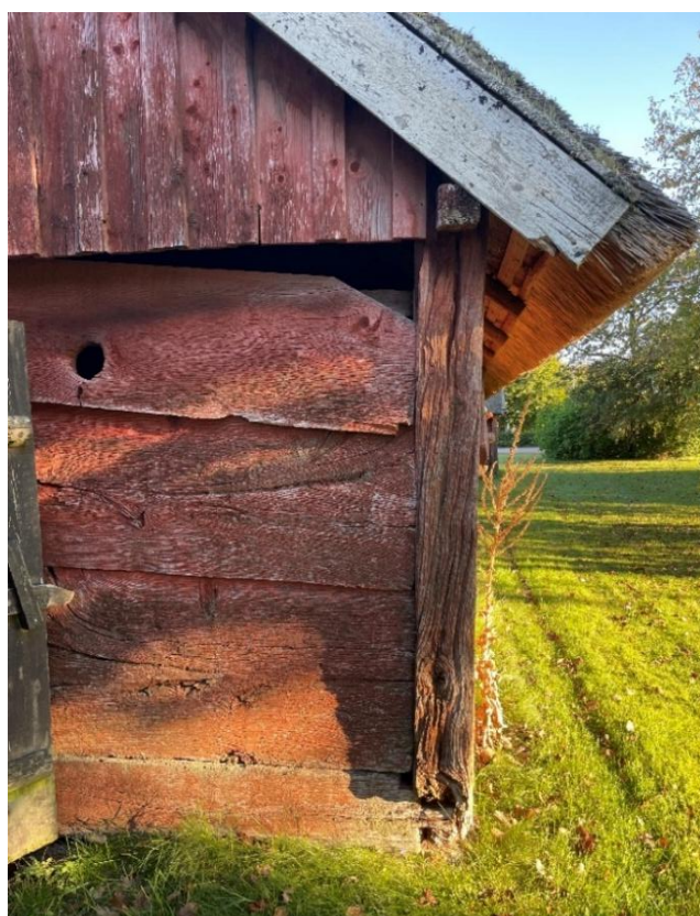
19. Detaljbilder på Larsagårdens varierande fasader. Hallandslängans grönmalade pardörr med rombmöster i både dörrblad och överljusfönster. Ryggåsstugans bara timmer med olika färgskiftningar samt den moderna torvtaks konstruktionen. Nedre bilderna visar förekomsten av varierande bredd och virke i uthusens skiftesverkskonstruktion.