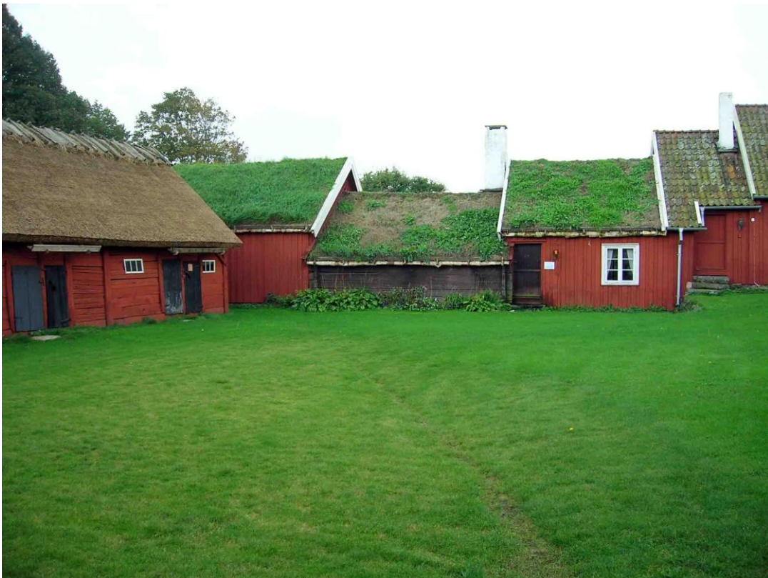
4. Höglöftsstugans norra fasad vänd in mot gården. Höglöftsstugans torvtak och hallandslängans enkupiga tegel som skymtar till höger har sedan dess bytts ut mot material av mer modern karaktär.

Larsagården är upptagen i den länstäckande Hallandsinventeringen år 2006 och klassificerades då till klass A. Vid inventeringen graderades bebyggelse i tre klasser A-B-C. Klass A innebär en byggnad med mycket högt kulturhistoriskt värde, mycket välbevarad exteriör och dessutom ofta även välbevarad interiör. En byggnad med klass A bedöms besitta en kombination av höga byggnads-, arkitektur- och samhällshistoriska värden och upplevelsevärden.