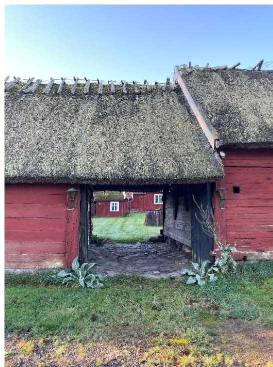
21. Fähusinredning västra gården där korna stått vända in mot rummets mittaxel. Till höger den stenlagda inkörporten.