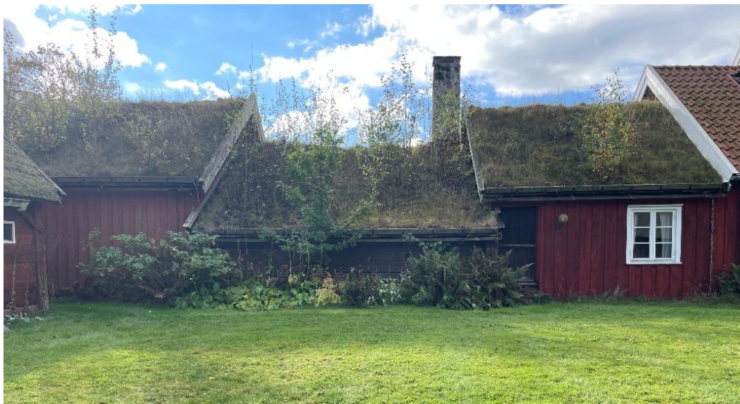
13. Höfloftsstugan norra fasader 2025. In mot gården är fasaderna slutna och ryggåsstugan delvis dold bakom växtlighet.