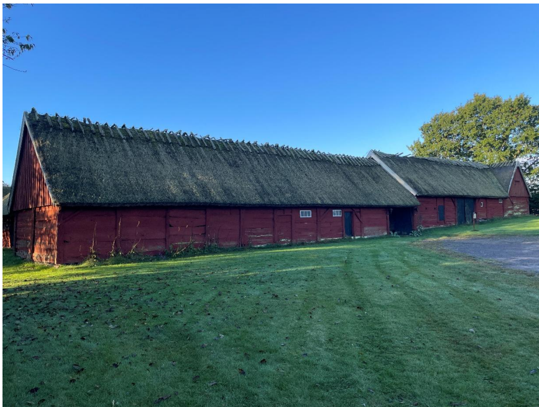
20. Uthusens långsträckta norra fasader mot grusparkeringen. Den överbyggda inkörsporten leder in till den gräsklädda omslutna innergården.