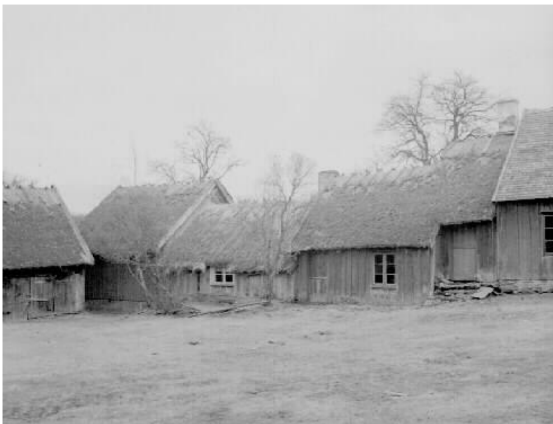
23. Höglöftsstugan och hallandslängans norra fasader, mot innergården 1958. Se bild 4 och 10 för jämförelse. Ryggåsstugan har här ett centralt placerat fönster och fasaden är brädfodrad. Något som togs bort i samband med flytten då det ansågs utgöra ett senare tillägg.

Sammantaget bedöms Larsagården besitta kulturhistoriskt värden men inte i den utsträckning att gården kan betraktas som synnerligen kulturhistoriskt värdefull ur ett regionalt och nationellt perspektiv. Larsagården tillhör inte heller de byggnadskategorier eller miljöer som bör prioriteras enligt Länsstyrelsens Strategi för nya byggnadsminnen i Hallands Län . Därtill får det anses att den typ av bebyggelse och berättelse som bygger upp Larsagårdens kulturhistoriska värde och karaktär till stor del redan finns representerade bland de halländska byggnadsminnena.