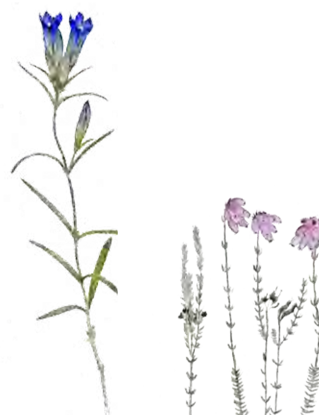
Klockgentiana Gentiana pneumonanthe Marsh gentian

Naturreservatet skyddar även strandängar på båda sidor av halvön. Ångsnäset, ett strandängsområde i söder, är ett värdefullt häckningsområde och fungerar även som rastplats åt flyttande vadarfåglar. Här är det beträdnadsförbud mellan 1 april och 15 juli för att ge de häckande strandängsfåglarna lugn och ro.