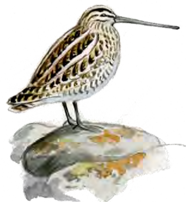
Enkelbeckasin Gallinago gallinago Common snipe

Within the Falsterbohalvöns havsområde Nature Reserve, which comprises the waters around the Falsterbo Peninsula, there are regulations which tell you where, when and how you can navigate in the aquatic area when e.g. wind surfing, kite surfing or going by boat. See separate information boards for this reserve. Where Falsterbohalvöns havsområde overlaps with Skanörs Ljung, the regulations of both reserves apply.