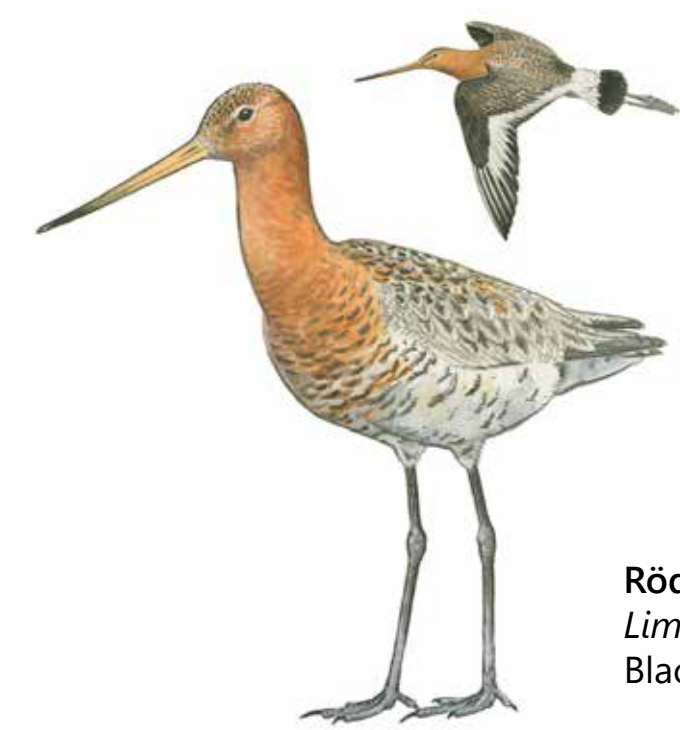
Rödspov Limosa limosa Black-tailed godwit