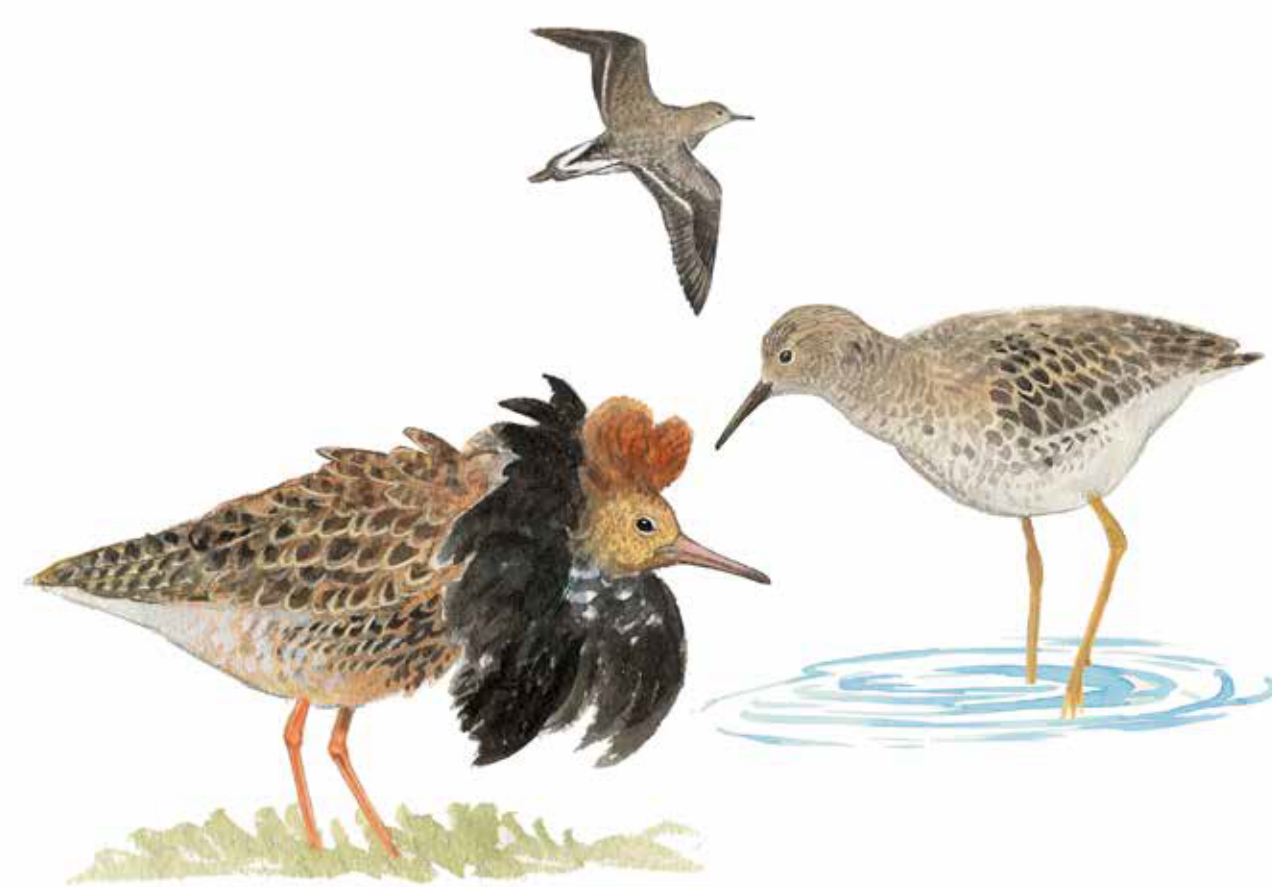
Brushane Philomachus pugnax Ruff

Bete, slätter och de årliga översvämningarna skapar en mångfald av mikromiljöer som tillgodoser en stor mängd fågelarters behov av livsmiljöer.