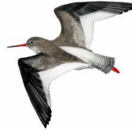
Rödbena Tringa totanus Common redshank