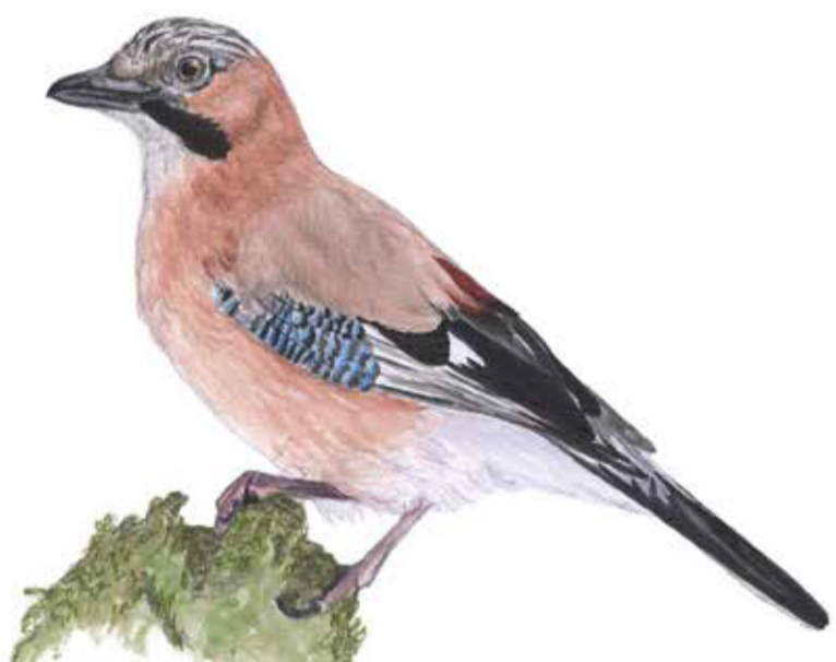
Nötskrika hamstrar ekollon inför vintern. Ibland glömmen hon gömstället och en ny ek kan börja gro. Garrulus glandarius Jay