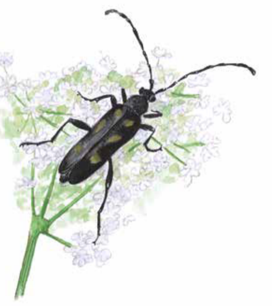
Sextvågnig hornbocka bockens larver lever i död ekved. Anoplodera sexguttata Six spotted longhorn beetle