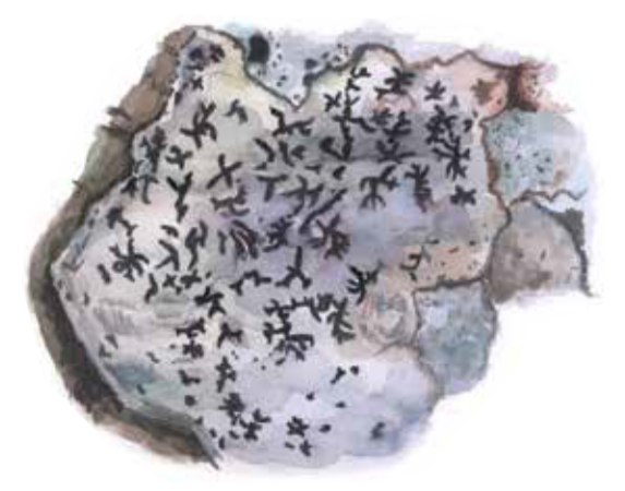
Stiftklotterlaven växer på gamla ädellövträd, oftast bok i Skåne. Opegrapha vermicellifera