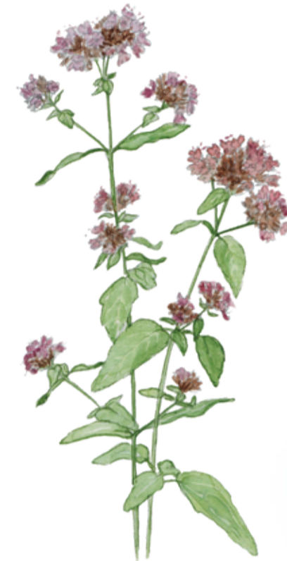
Kungsmynta Origanum vulgare Wild marjoram

Förutom mäktiga lager av sand finns lera som är perfekt för tegeltillverkning. Bara längs kusten mellan Helsingborg och Landskrona fanns det nästan 40 tegelbruk. Det sista slog igen 1968. En del av de övergivna gamla lergravarna är idag vattenfyllda och har blivit ett tillhåll för den sällsynta grönfläckiga paddan.