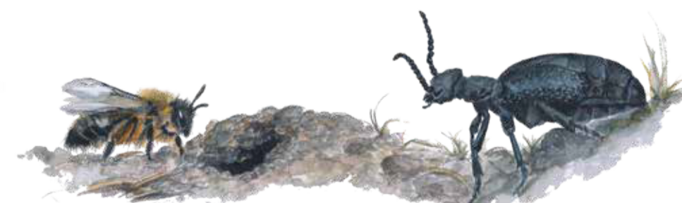
Gyllensandbi Andrena nigroaenea Buff mining bee

De sandiga backarna med blommor fulla med pollen och nektar lockar många vilda bin. Den lättgrävda, solvarma sanden är den perfekta barnkammaren för många ovanliga bin. Men de får se upp för majbaggen, som har bin på menyn.