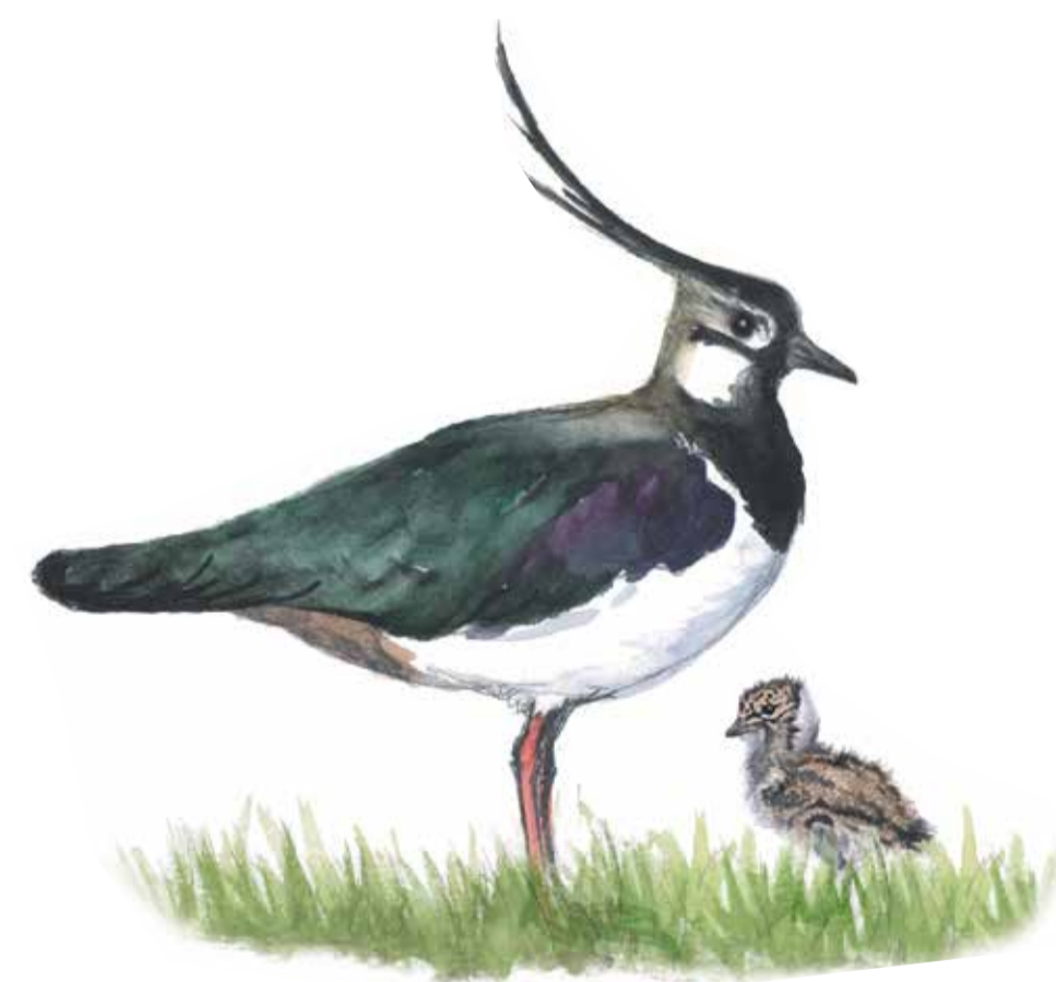
Tofsvipa, Vanellus vanellus , Lapwing

Bredeväg flyter fram mellan tångvallarna i mitten av naturreservatet. På medeltiden var det en viktig transportled där mindre pråmar fraktade varor upp till Skanör från båtar i bukten och återvände med tunnor med sill. Det var först när hamnen byggdes i slutet av 1800-talet som pråmarna slutade dras längs Bredeväg. Tångvallarna är kustlandskapets speciella staket som skiljer åkrarna från betesmarkens djur. Idag är hela halvön betesmark.