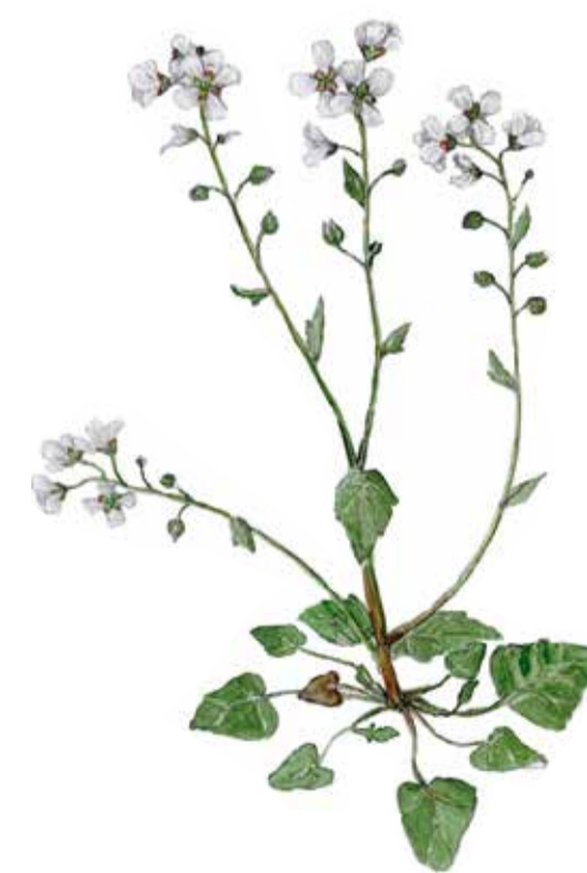
Skörbjuggsört Cochlearia officinalis Common scurvygrass

Grunda vattenområden och stränder är viktiga rastplatser för fåglar under vår och höst. Naturreservatets utbredda vassar med havssäv och grunda mjukbottnar besöks årligen av änder, gäss och vadare. På hösten bjuds det också på rovfåglar som sträcker ut över havet.