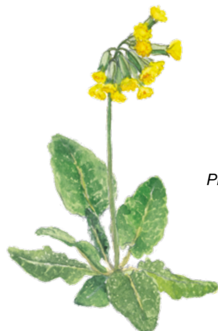
Gullviva Primula veris Cowslip