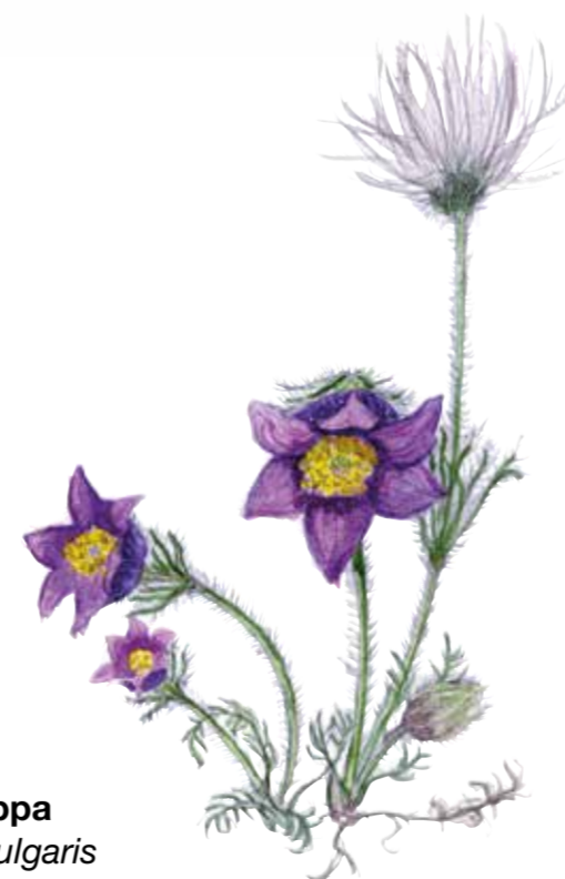
Backsippa Pulsatilla vulgaris Pasqueflower