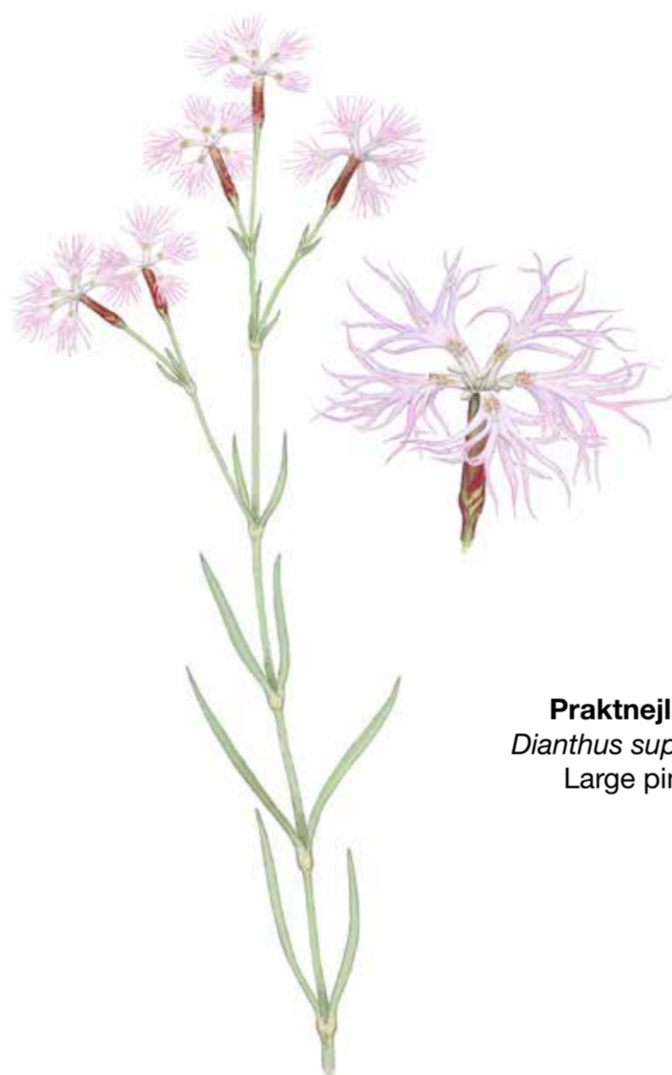
Praktnejlika Dianthus superbus Large pink