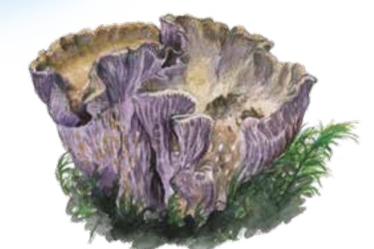
Violgubbe ( Gomphus clavatus ) är en av de hotade arterna i reservatet. Den bildar bortåt tio meter stora häxringar. Pig's ears