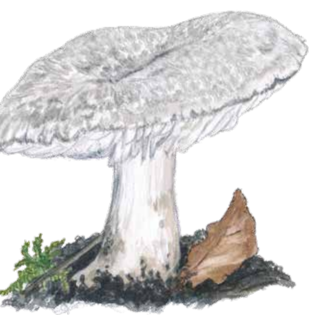
Pantermusseron ( Tricholoma filamentosum ) är stor och kraftig och doftar mjöl. Tricholoma filamentosum