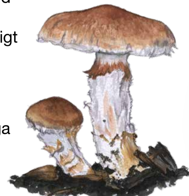
Rävspindling ( Cortinarius vulpinus ) är beroende av rötter till gamla bokar på kalkrik mark. Cortinarius vulpinus