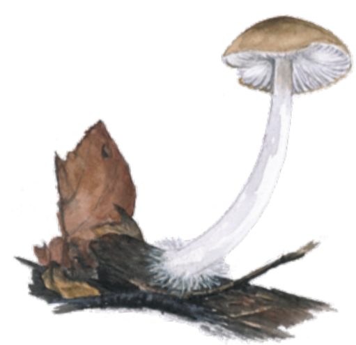
Blek fjunfoting ( Hydropus subalpinus ) växer i lövskog på små begravnade träpinnar. Hydropus subalpinus

Rara svampar Den höga, jämna, fuktigheten i skogen gör att många arter av svampar trivs i reservatet. Sänkningen av Oppmannasjön i slutet av 1800-talet har bidragit med nya, relativt varma, strandbrinkar. Detta gör Brinkahagen-Möllerödsnäs till en av norra Europas rikaste lokaler för marklevande svampar. Här finns ett sjuttiofåtal sällsynta eller hotade svamparter.