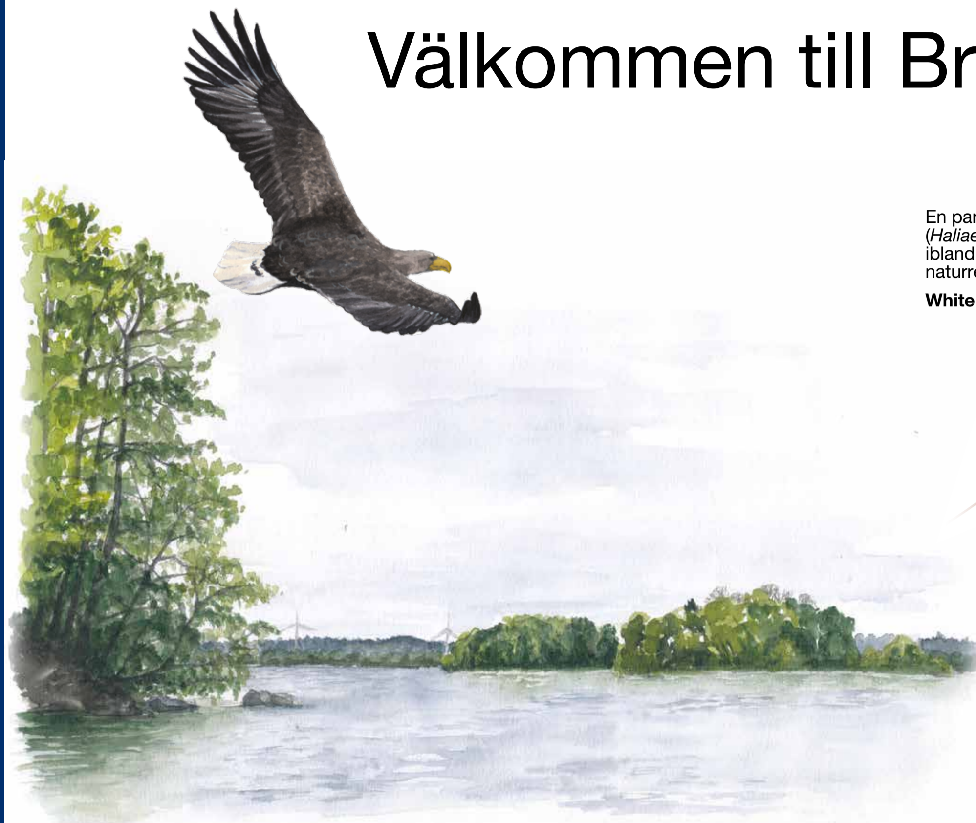
En pampig havsörn ( Haliaeetus albicilla ) seglar ibland majestätiskt över naturreservatets öar. White tailed eagle