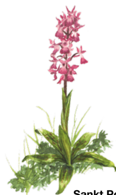
Sankt Pers Nycklar Early purple orchid Orchis mascula