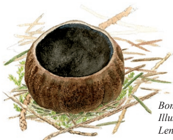
Bombmurkla Illustratör: Lennart Molin

Här i reservatet får du plocka både bär och matsvamp. Ta med dig svamkorgen och håll utkik efter kantareller, trattkantareller, trumpetsvamp och karljohansvamp. Under din vandring får du troligen sällskap av olika fåglar. I granskogar som denna trivs exempelvis mesar och trastar. Från mossarna kan du höra tranor ropa. Genom Mantorpskogen löper även Axbergs kyrkstig från Axberg till Rinkaby.