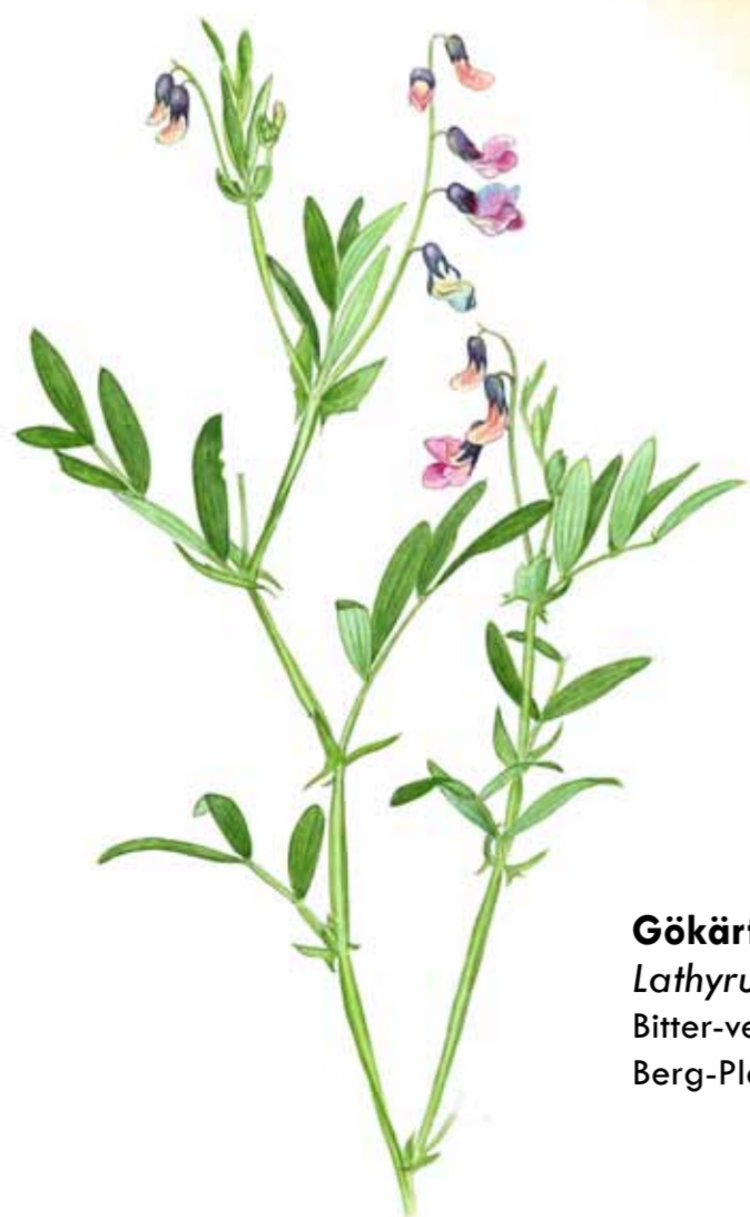
Gökärt Lathyrus linifolius Bitter-vetch Berg-Platterbse