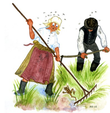
Myrslätter Illustration: Margareta Hildebrandt

På en gammal karta från 1800-talet kan man se att stora delar av reservatet var ängsmark som hölls öppen genom myrslätter. Höet användes som vinterfoder till djuren. Samma karta visar också att det fanns ett torp vid namn Mon i den norra delen av reservatet.