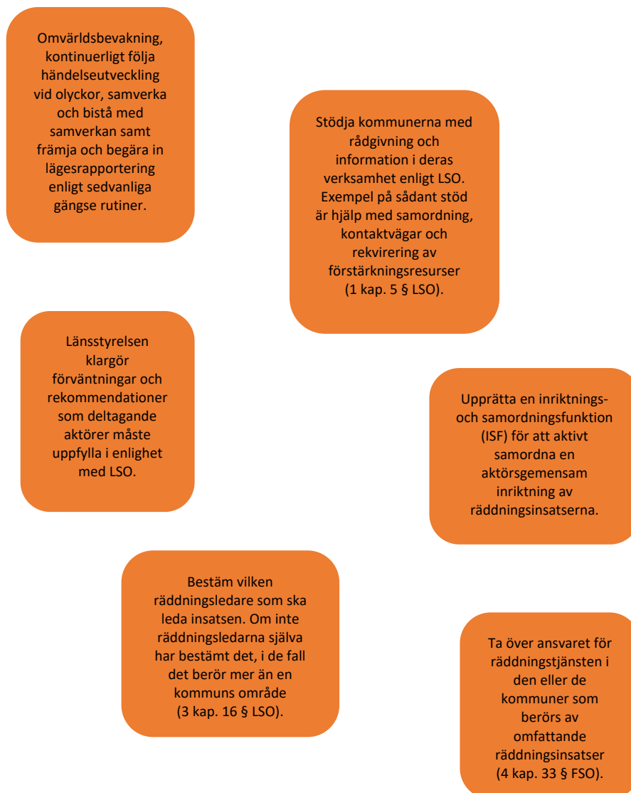
Figur 3 Stöd i analysprocessen inför ett eventuellt övertagande

Vägen till ett övertagande sker parallellt med flera andra åtgärder och flera hänsynstagande måste ske innan ett övertagande är aktuellt. De olika åtgärderna kan komma i olika ordning beroende på situationens karaktär. Beroende på händelse kan det även vara så att vissa åtgärder inte behövs. De olika åtgärderna illustreras i bilden nedan.