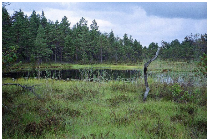
Kosimossen i Dunderklintarnas naturreservat.

Naturreservaten Dunderklintarna och Svenshyttan utgör ett stort vildmarksområde med gammelskog och myrar i kanten av Kilsbergen. Med lite tur kan du här stöta på både järpe och tretåig hackspett. På våren spelar orrarna ute på Dammsjömossen.