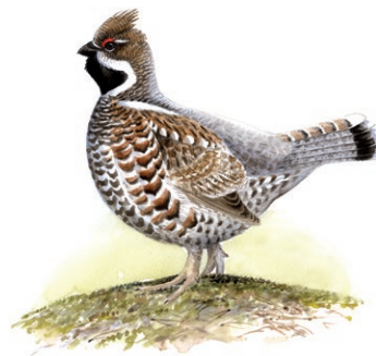
Järptupp Illustration: Jonas Lundin

Död ved låter kanske inte så spännande men är faktiskt allt annat än dött. För många är de olika mossor, svampar och inte minst insekter som lever av just död ved. Inne i veden lägger många skalbaggar sina ägg, som där utvecklas till larver och äter av den döda veden. Larverna i sin tur är populär föda för många hackspettar och andra fåglar. Har du tur kan du få en skymt av den sällsynta tretåiga hackspetten med sin gula hjässa. Här finns även två av våra vilda hönsfåglararter, tjäder och järpe.