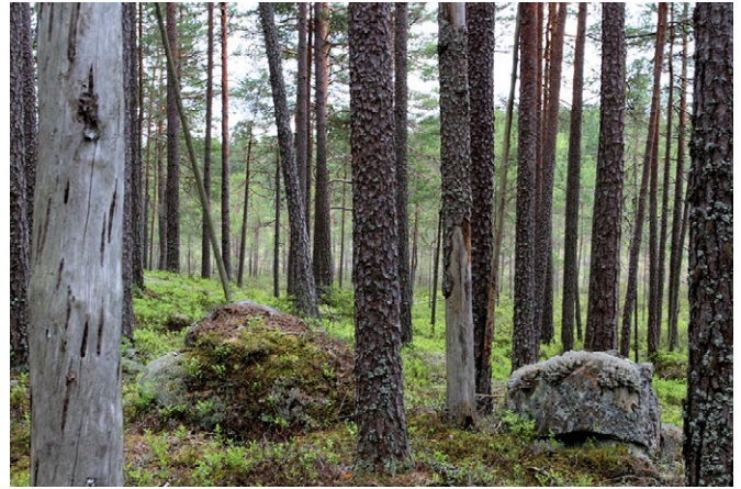
Tallskog vid Klosstjärnen.

Här och var i reservatet finns det gott om död ved i olika stadier av nedbrytning. I och på den döda veden trivs många hotade och specialiserade arter. Bland svamparna finns exempelvis tallgråticka, granticka, gränsticka, svart och orange taggsvamp. Flera exemplar av den ståtliga koralllaven har även hittats i reservatet. Den växer vanligtvis på block och lodytor men hittas här i Siksandshöjden främst på lövträd. Den kräsna laven växer bara där det varit skog under lång tid. Tretåig