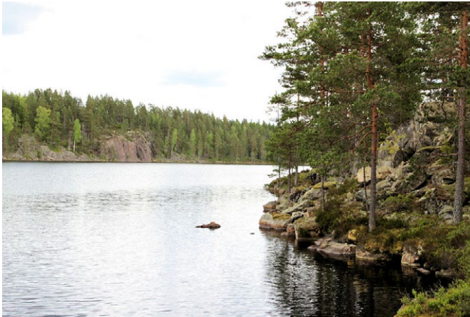
Rasbranter vid Hälltjärnen.

Naturreseptat Siksandshöjden består av ett småkuperat myr- och skogsområde med flera små sjöar. Här möter du en varierad natur med stark vildmarksprägel.