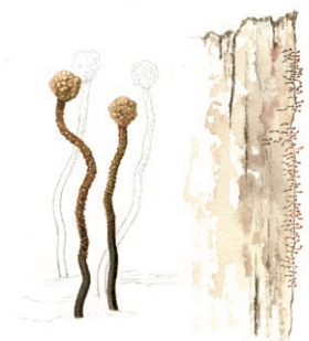
Brunpudrad nållav (förstoring t. v.) Illustration: Lennart Molin