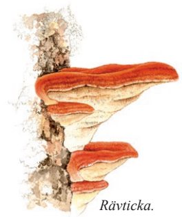
Rävticka. Illustration: Lennart Molin