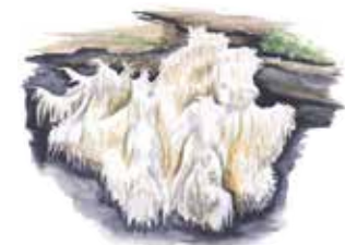
Koralltaggsvamp Heridium coralloides

Den ovanliga bokblombeckens larver lever i död ved i gamla bokar.