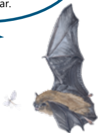
Illustration: Katarina Månsson

Dvärgpipistrelan jagar högt inne bland trädskronorna. Den äter små insekter som myggor, nattsländor och småfjärilar.