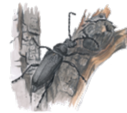
Bokblombeck Stictoleptura scutellata

Den ovanliga bokblombeckens larver lever i död ved i gamla bokar.