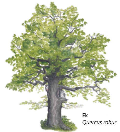
Ek Quercus robur

Svaneholm utmärker sig för sina många rara svampar. Några av dem har namn som rödfotad nagelskivling, cinnoberspindling, oxtungssvamp, koralltaggsvamp och sydlig platticka.