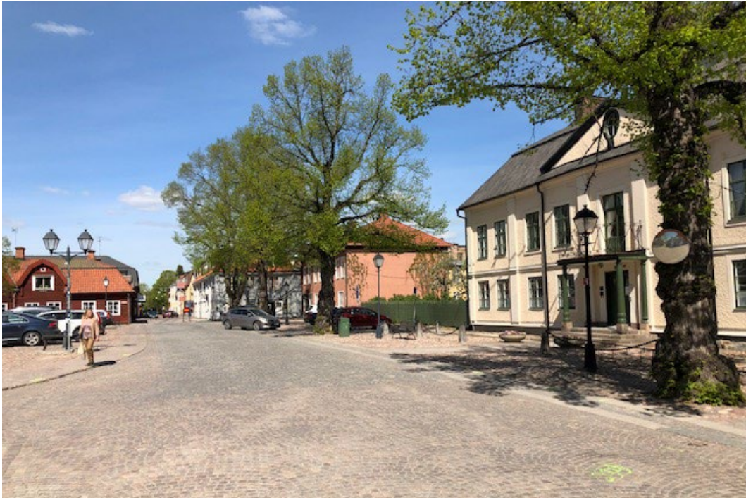
Figur 1. Stora torget i Hedemora.

Sahlbergska gården är en stadsgård som ligger vid Stora torget i Hedemora, i hörnet Kyrkogatan-Ämbetsgatan. Gården har en sluten innergård, som man når genom ett stort portlider.