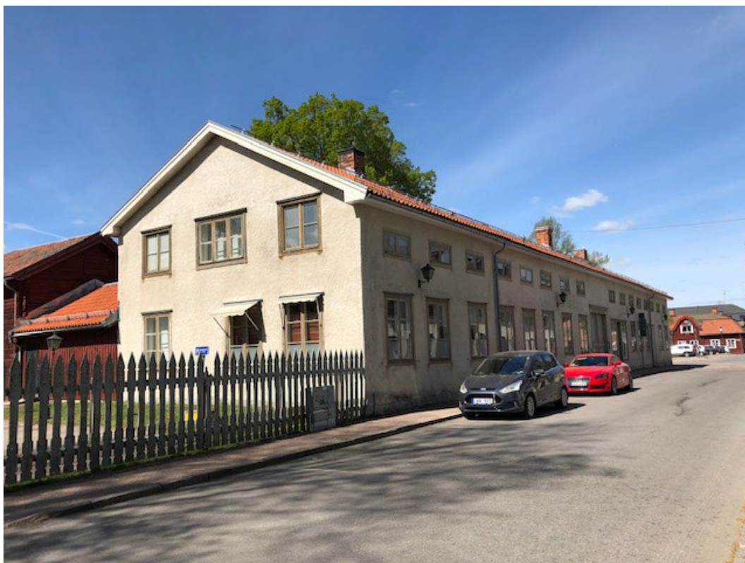
Figur 2. Fasaden mot Kyrkogatan med portluder in till gården. Längst till höger i bild skymtar Stora torget. Till vänster syns de röda timmerbyggnaderna på innergården.

På gården står två rödfärgade uthus av timmer, placerade i vinkel. De är sannolikt uppförda vid mitten av 1800-talet. Uthusen har sadeltak täckta av enkupigt rött taktegel och svarta portar. Mitt på den öppna gården finns en liten gräsyta med ett stort vådräd, omgiven av grusgångar. Inne på gården finns också två källarnedgångar, en i sydväst och en i nordväst. Källaren i sydväst har ett stort och högt källarvalv. De två källarna hör samman med den bebyggelse som fanns på tomten före stadsbranden 1849. Källaren i nordväst har en förbindelse med huvudbyggnadens källare.