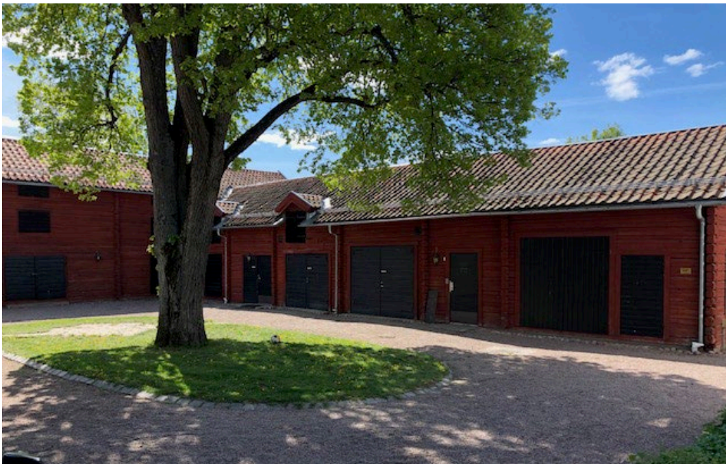
Figur 4. . Innergårdens timmerbyggnader.