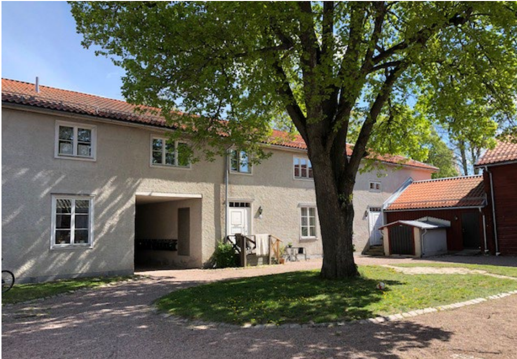
Figur 3. Huvudbyggnadens reveterade fasad in mot gården.