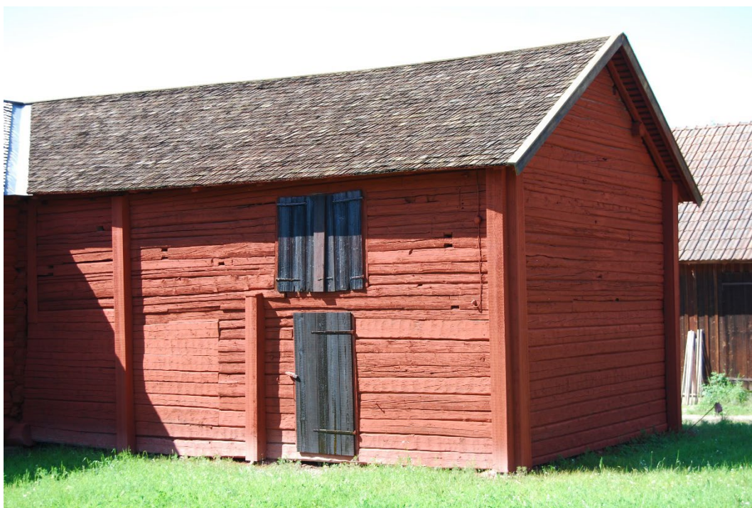
Figur 3. Stallbyggnaden från 1700-1800-tal, sammanbyggd med den medeltida parlogen.