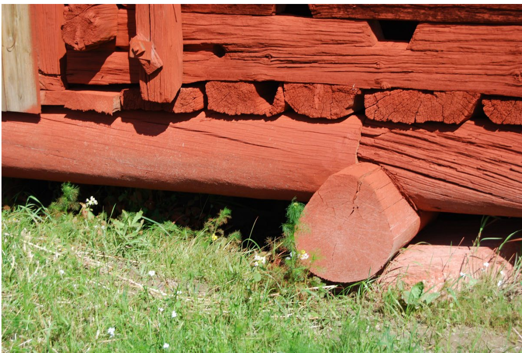
Figur 6. Syll och nedre stockvarv, vilka är fasetthuggna till skillnad från övrig rundtimrad vägg.