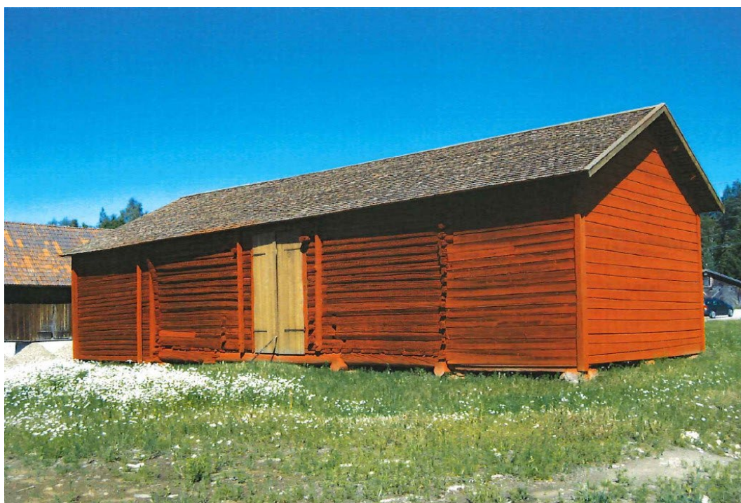
Figur 2. Parlogens södra fasad. Till höger den påbyggda ladugården från ca 1900.

Själva logen är uppförd i en medeltida timringsteknik av samma typ som Ornäsloftet. Byggnaden är en parloge av för sin tid ovanlig storlek. Som parloge är byggnaden den äldsta kända i Dalarna. I logen finns en runrad inristad. Logbalkar och klivstockar finns bevarade. Loggolvet har en ålderdomlig utformning. De nedre stockvarven är fasetthuggna, i övrigt är väggarna av rundtimmer, men knutarna är av samma medeltida typ, utom de översta som har en modernare form. Pardörrarna på de båda långsidorna har vidgats i senare tid och de översta stockvarven timrats på.