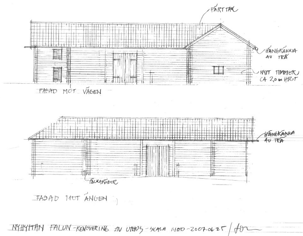
Figur 1. Ritningar inför restaureringen som genomfördes innan byggnadsminnesförklaringen, ur rapport Parloge i Nyhyttan 2009.07.15.

Parlogen i Nyhyttan ligger i Vika utanför Falun.