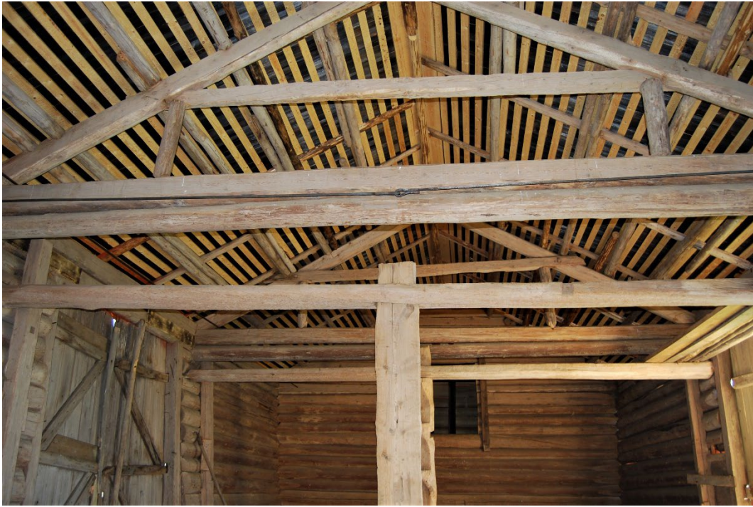
Figur 7. Takkonstruktionen har restaurerats.