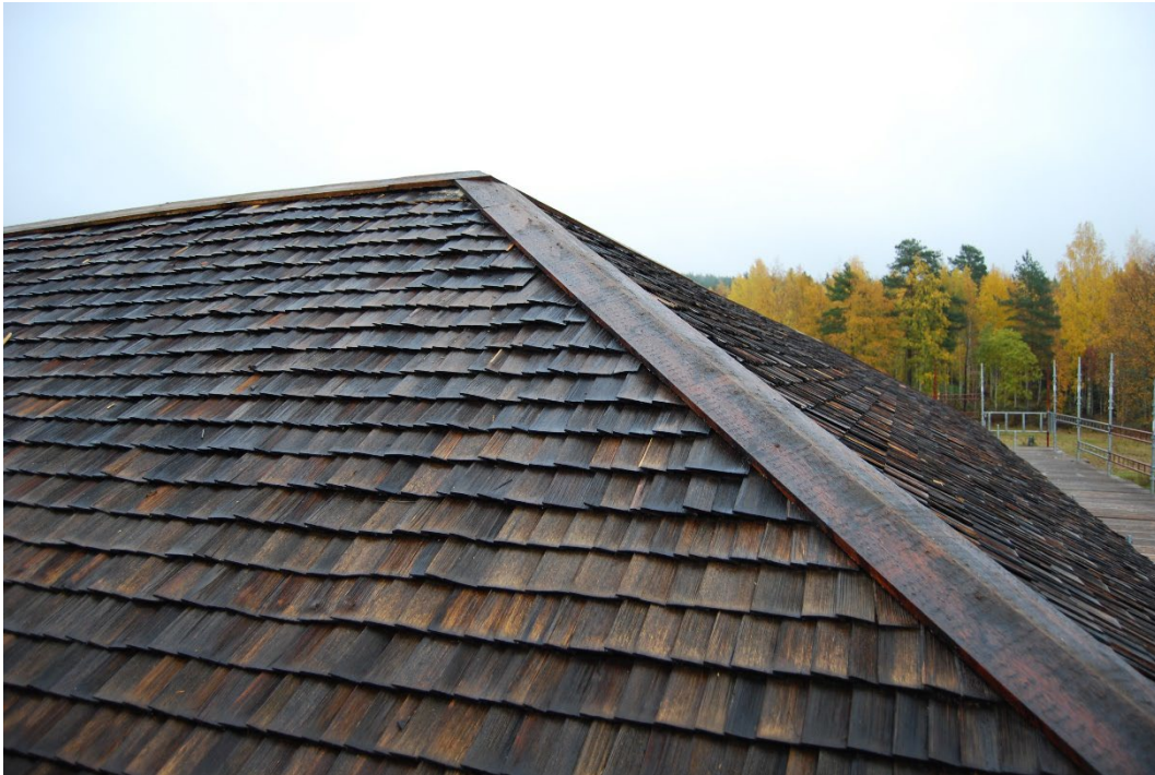
Figur 5. Taket är belagt med pärt (spån).