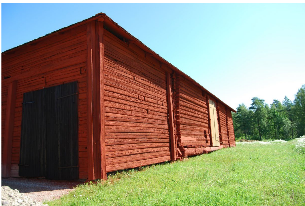
Figur 4. Timret i parlogen har dendrodaterats till 1472–73.