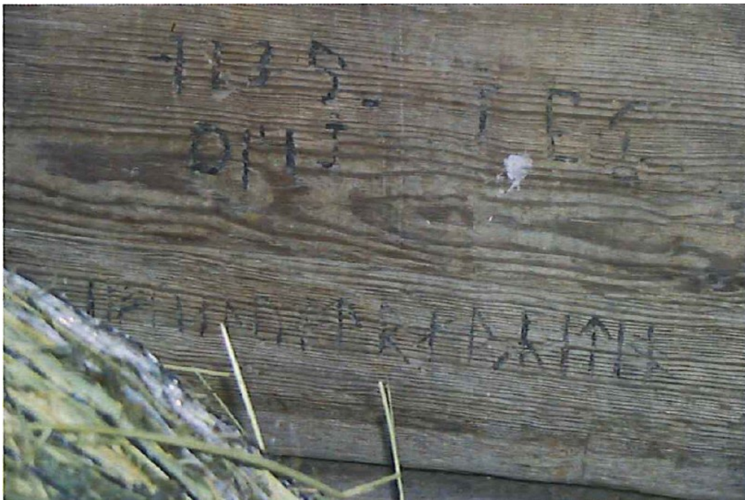
Figur 8. Runraden inne i logen.