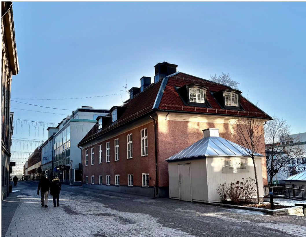
Figur 1. Munktellska huset ligger längs huvudgatan genom Falu stadskärna, Åsgatan.

Kvarteret Vedkompaniet, beläget centralt i Faluns stadskärna, inramas av Åsgatan, Bergslagsgränd och Holmgatan. Framför byggnaden finns idag Geislerska parken, som sommartid upptas av en uteservering. Parken omgärdas av ett järnstaket och en trappa leder ner mot Holmgatan.