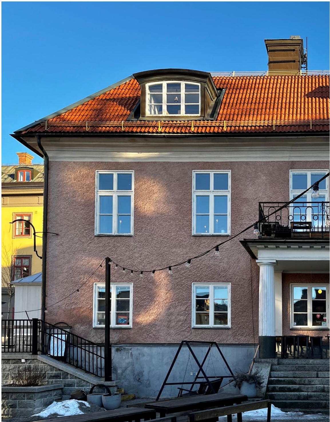
Figur 5. Fönstersättningen är regelbunden och symmetrisk, och fönstrens höjd avslöjar interiörens plan med salar i fil på övervåningen. Till höger huvudentrén.