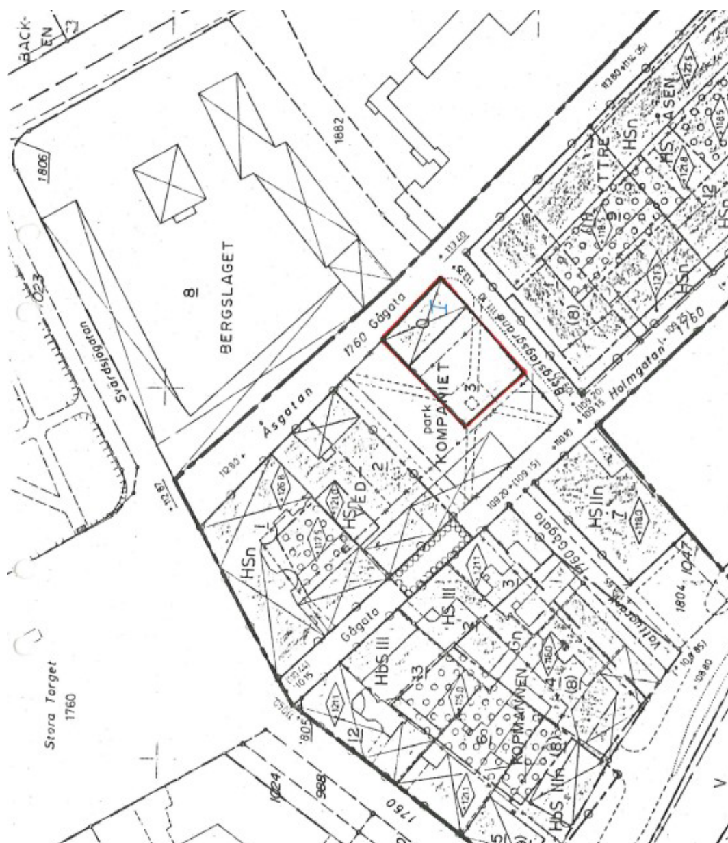
Figur 6. Situationsplan för byggnadsminnet Munktellska huset, ur beslut 1980.02.18.