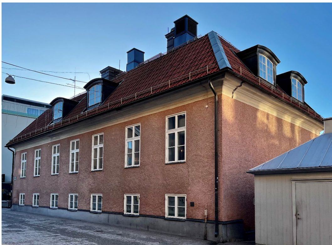
Figur 4. Den nordöstra fasaden vetter mot Åsgatan.