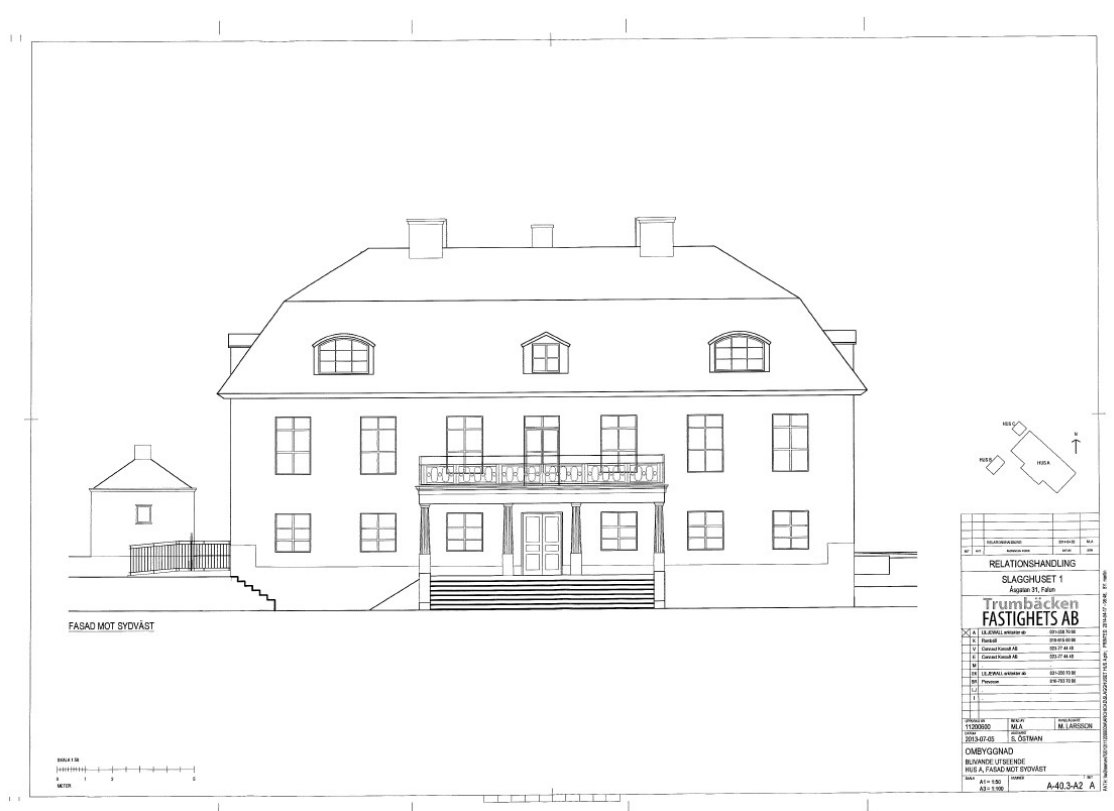
Figur 2. Uppmåtningsritning inför ombyggnad 2013, Trumbäcken Fastighets AB.

En bred stentrappa leder fram till entrén. Rakt ovanför denna ligger en balkong som bärs upp av fyra kolonner med räfflade kanellyrer, vilka vilar på trappan. Trappan och kolonnerna tillkom i samband med att huset byggdes om till bergslagsmässa 1919. Tidigare fanns där en veranda byggd 1897. I parken framför huset står en urna av skulptören Eric Grate. Munktellska huset renoverades 2013-2014.