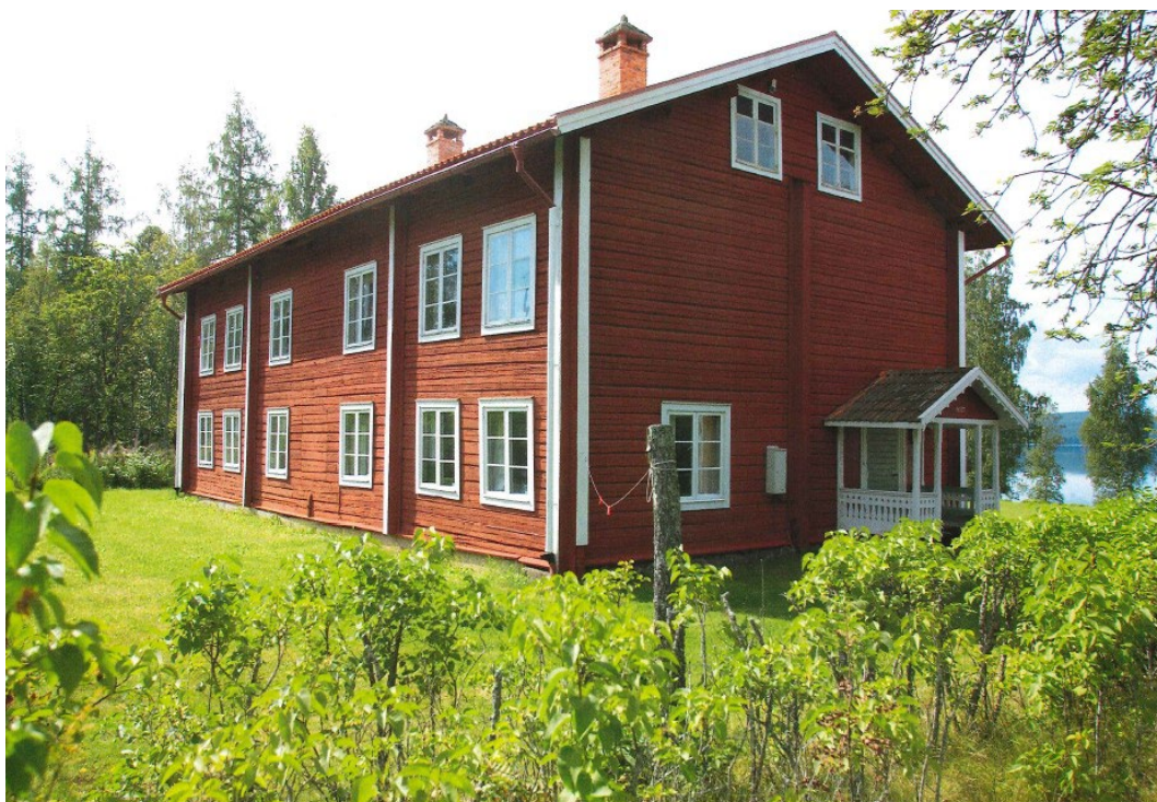
Figur 1. Huvudbyggnaden sedd från vägen.