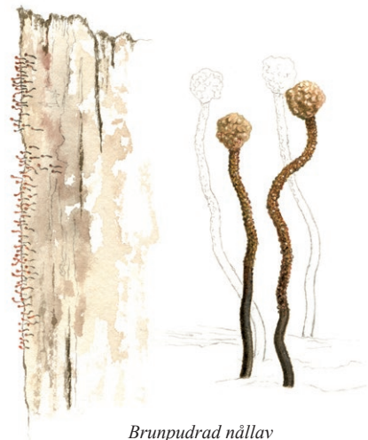
Brunpudrad nållav (förstoring till höger) Illustration: Lennart Molin

Andra flitiga skogsinvånare är hackspettarna, som bearbetar träden minst lika intensivt som bävern, fast med ett annat mål i sikte. De är ute efter smaskiga larver och insekter under barken eller hacka ut hål som är lagom stora att bygga bo i. Den tretåiga hackspetten gör också små hål som löper likt ringar runt granstammarna. Det är den söta saven som lockar.