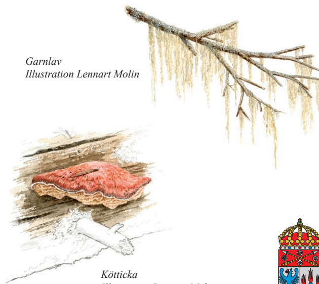
Kötticka Illustration Lennart Molin