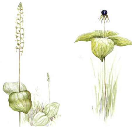
Tvåblad och ormbär. Illustrationer: Jonas Lundin