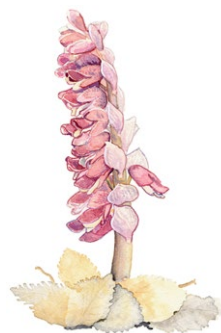
Vätters. Illustration: Michael Holmberg