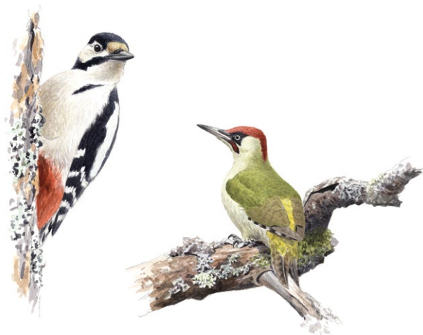
Större hackspett och gröngöling Illustrationer: Niklas Johansson

Ädellövlunden var tidigare betad och var då glesare och mer ljusöppen. Reservatets norra del betas fortfarande. Här finns en intressant flora med kalkgynnade hagmarksväxter, däribland gullviva och rosettjungfrulin.