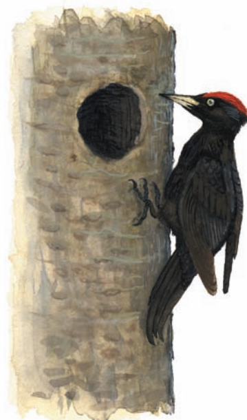
Illustration: Michael Holmberg

Förr brann skogarna regelbundet, kanske vart 40:e år i snitt, och skogsbruk bedrevs inte annat än som husbehovstäck av virke och ved. Andelen lövträd var därför högre och det fanns gott om döda trädstammar. I den moderna, brukade skogen råder däremot brist både på grova lövträd och döda träd vilket gör att många insekter, svampar, mossor och lavar är utrotningshotade.