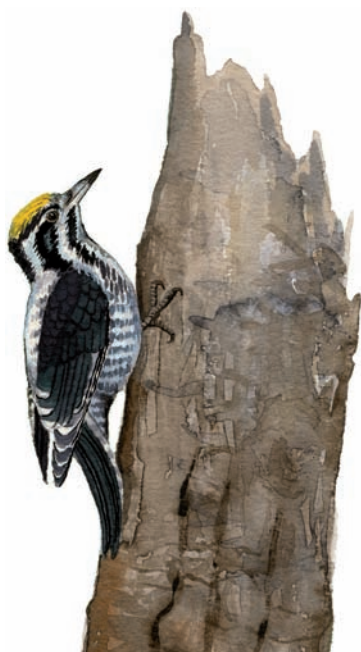
Illustration: Michael Holmberg